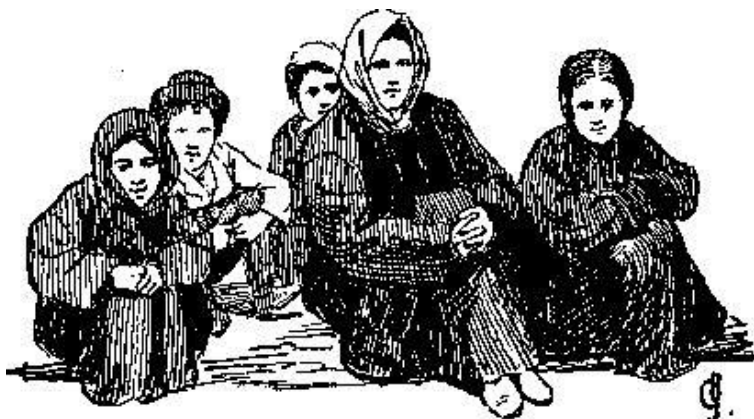
Bukovinai magyar gyermekek az 1883-iki visszatelepülők között