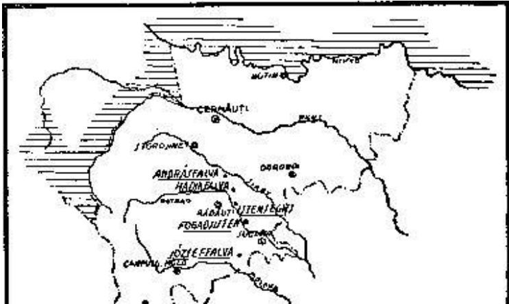
A bukovinai magyar im vak földrajzi fekvése

A szomorú emlékű „madéfalvi veszedelem“ után az Erdélybe küldött bűnfenyítő vizsgáló bizottság 1765.