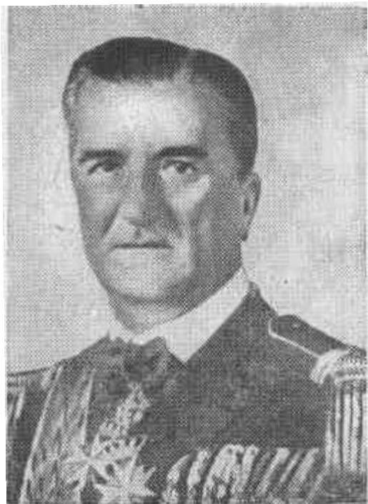
vitész nagybányai HORTHY MIKLÓS Magyarország kormányzója.