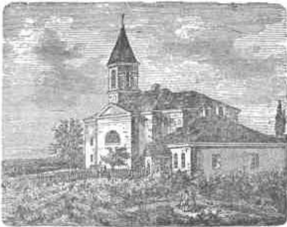
A hadikfalvi templom és a régi iskola