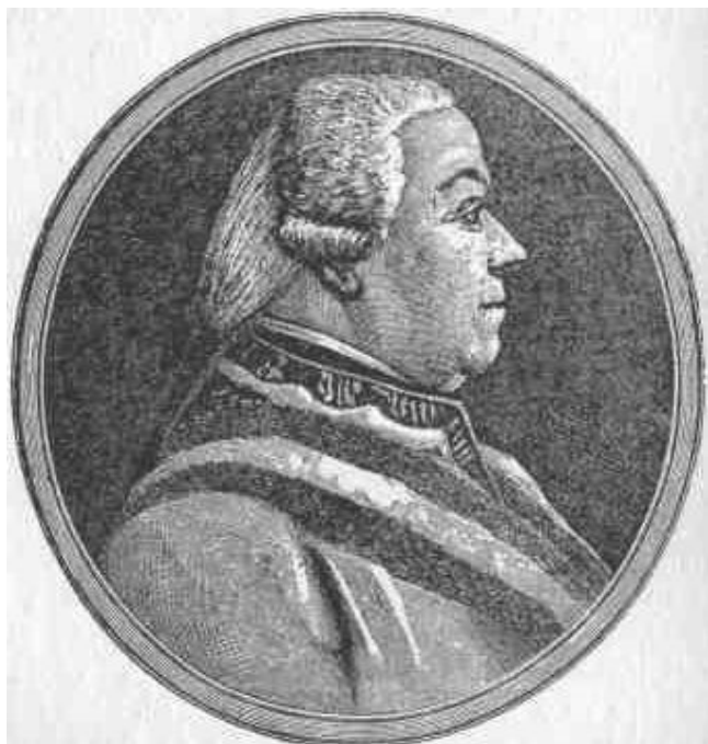
futaki gróf Hadik András tábornagy

Szorgalmazta a vizsgálat befejezését, azon volt, hogy az ártatlanokat hazaengedjék és mindenki viszszaérhesse otthonának felépítésére.