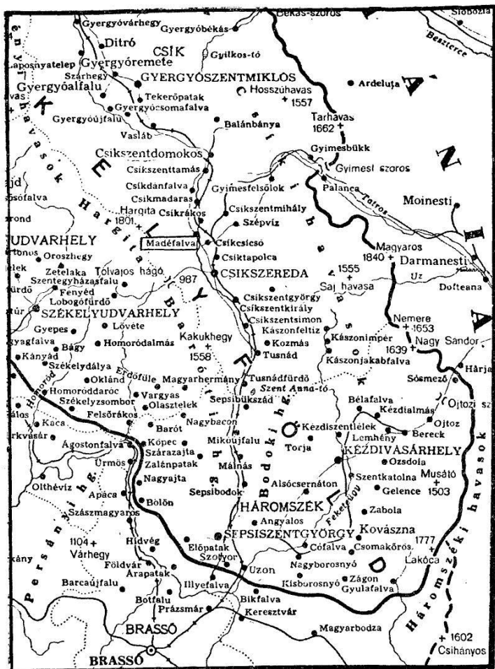
A székely határvicék

A kiadott rendelet szerint: 1. azokat, akik tüzelő fegyverrel ellenállnak, főként pedig a háromszékie-