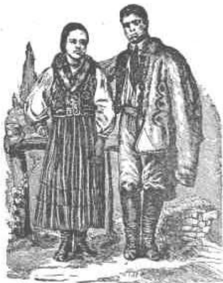
Bukovinai magyar leány és legény (mátkapár)

Már korán reggel élénk és színes volt a kis búcsújáró hely. — A gyönyörű napsütéses időjárás is kedvezett a búcsúnak. Minden magyar község kitett magáért. Gyalog, s aki nem tehetett, kocsin, teherautókon, vonaton, de mire én megérkeztem, már ők is ott voltak. Az egész község olyan volt, mint egy virágos kert. Körül a dombokon zöldelő fák, s bent a téren, az utakon, a templom körül a sok színes öltözetű nép.