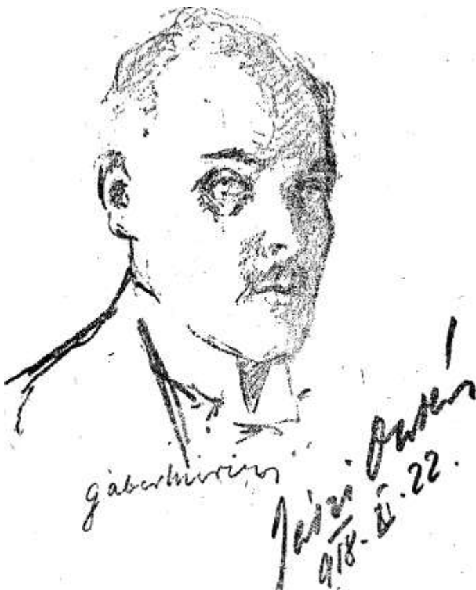
JÁSZI OSZKÁR nemzetiségi miniszter

— Miféle intézkedés történt ... — kezdett