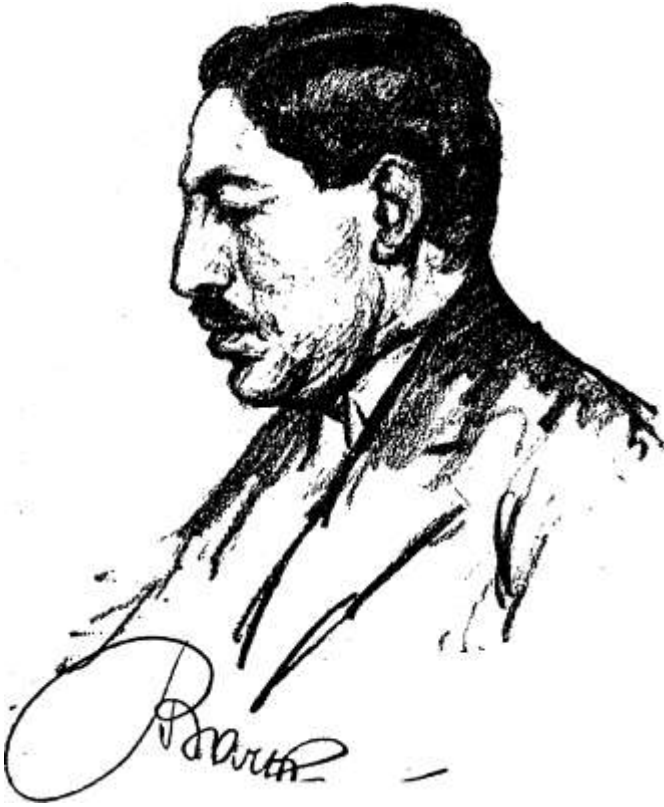
BARTHA ALBERT hadügyminiszter

az inotai tanezred, amely már napok óta megegyezett a Nemzeti Tanácssal és egyezségéhez híven nem áll ellen a népnek, hanem megnyitja a kor-