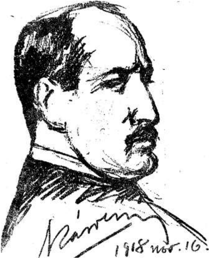
GRÓF KÁROLYI MIHÁLY

valami nagy vívmányt jelenti be a miniszterelnök a perszonális uniót. Közben az Egyesült Államok elnöke újra üzen: tárgyaljunk és béküljünk meg a