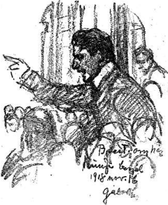
KUNFI ZSIGMOND DR. népjóléti miniszter beszél az Országház kupolatermében a november 16-iki Nemzetgyűlésen

A stratégiai terv megállapítására azért kerülhetett a sor, mert a Nemzeti Tanács ekkor már átlát Lukachich szándékán és ismeri azokat a csa-