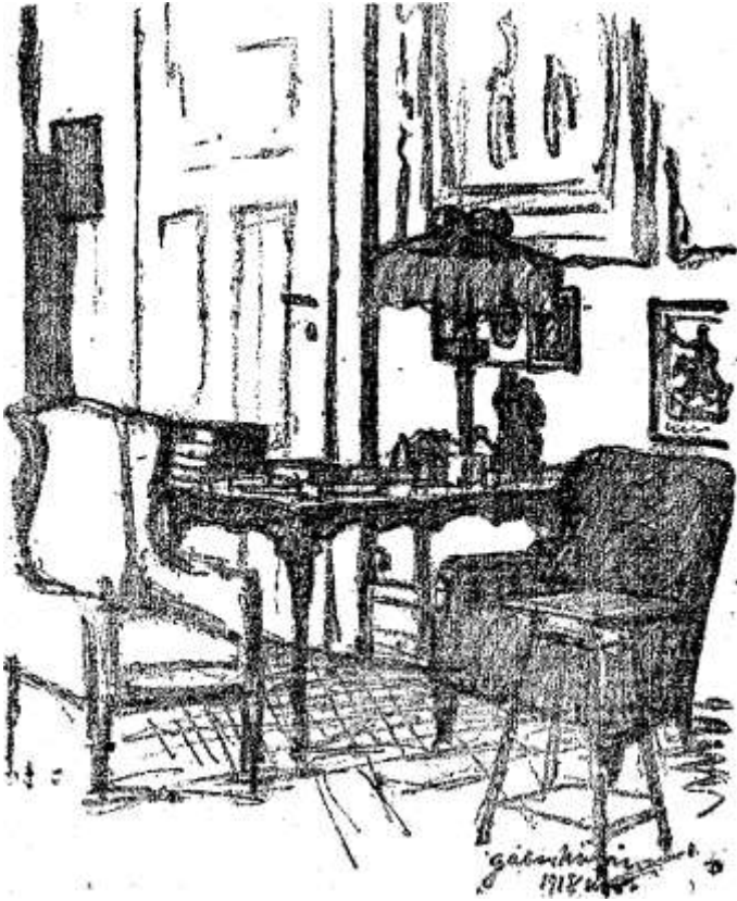
A Károlyi-palota egyik írószobája, ahol a Nemzeti Tanács és a Katonatanács először találkozott

A hadbírótság ügyészségén várja az esetleg letartóztatott forradalmárokat, hogy helyzetükön