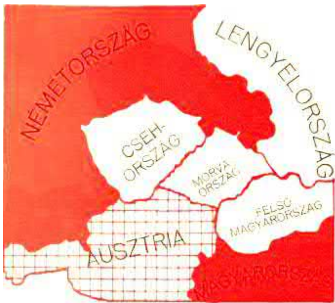
A DUNA MEDENCÉJÉNEK SZEREPE.