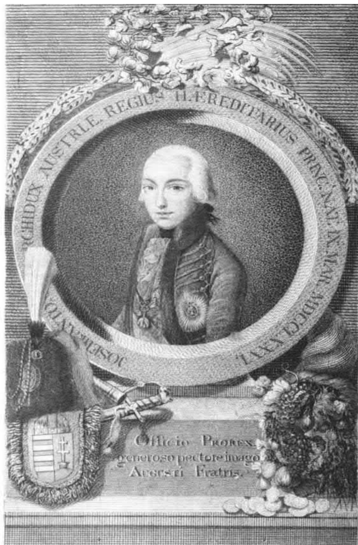
JÓZSEF FŐHERCEG NÁDOR. 1796.