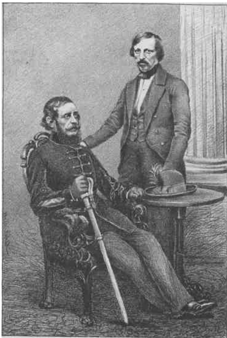
Kossuth és Pulszky arczképe. (Készült Bostonban 1852.)

ismeretet szerzett magának, mikről Európában tett nagy utazásai alatt fogalmat sem nyerhetett. Megismerte az új világrésznek eddig csak könyvekből is hézagosan tudott közállapotait, életrevaló népének gyakorlati felfogását, munkás életét, melyben a tétlenség nem irigyelt, hanem megvetett állapot. Alkalma nyílt érintkezésbe