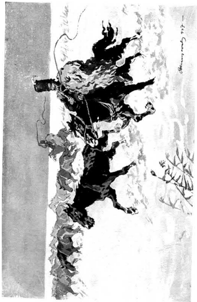
Szilaj ménes a téli legelőn.