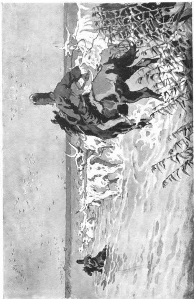
A gulyát dőverik a vízben.