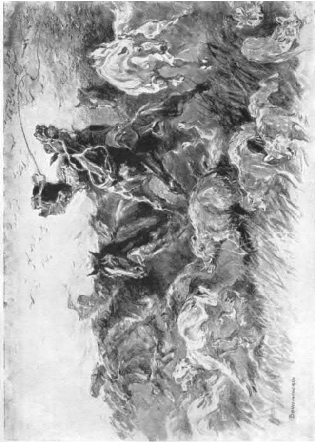
Menekülés a futótűz elől.