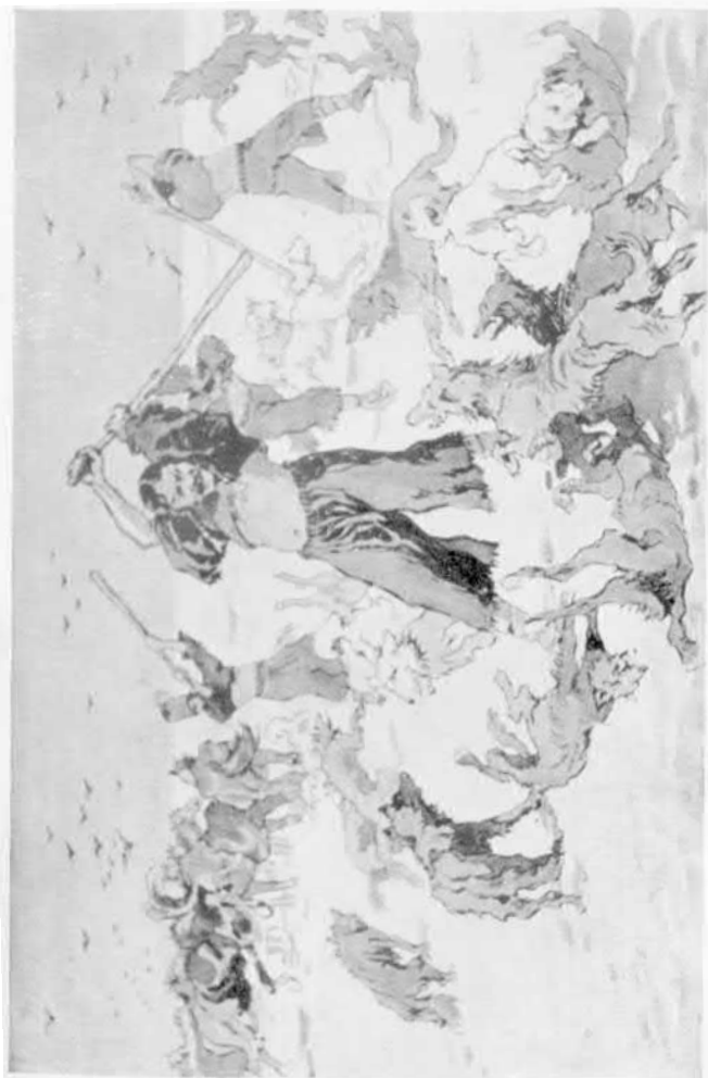
Küszteletem a farkasokkal.