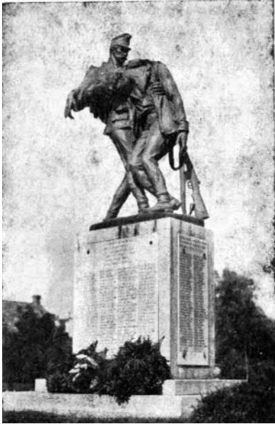
A Hősök emlékműve Szekszárdon.

lenne, ha Szekszárdnak megvolna a lehetősége, hogy gyorsabban fejlődjön.