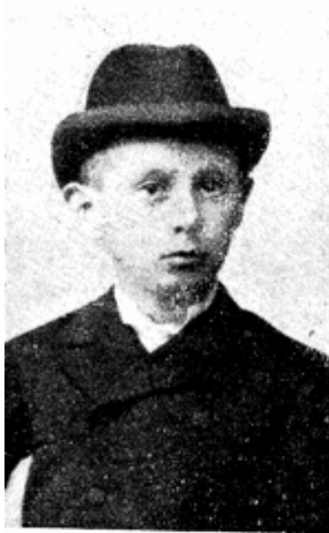
Krúdy Gyula (gyerekkori kép)