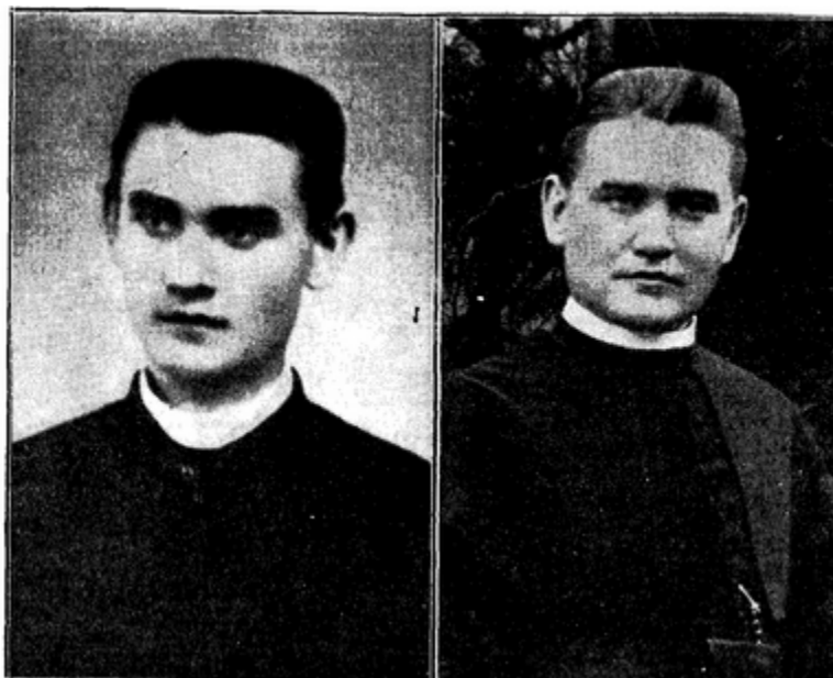
A miniszter ifjú korában

hogy az Eötvös Loránt-törvény cikk 3-ik pontja alapján engem mindjárt a 3-ik elemibe dobtak, de fizikailag a nyakamnál fogva, ténylegesen odahajítottak. Így öröklődött belém a Vass-família »bötűszeretete«.