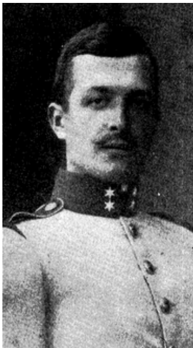
SZABÓ SÁNDOR 1910-ből

Egy évi jegyzőgyakornoki működés után jöttem Budapestre a