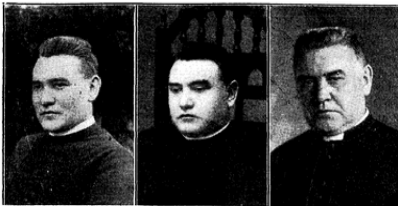
Vass miniszter fotográfiái

mayer-erszény, amit a püspök elutazásom előtt egy órával adott át nekem, hetvenhét körmöci aranyat tett bele, hogy hét esztendő múlva legyen miből hazautaznom. Ő szegény, két évre rá meghalt.