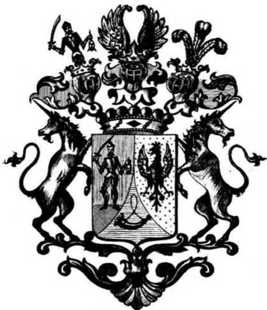
Podmaniczky család (Podmanini és aszódi báró).

A Podmaniczkyak — vagy mint legrégebben neveztek: Podmaniniak (latinul «de Podmanin») Trencsén vármegye egy legrégebbi törzscsaláda,