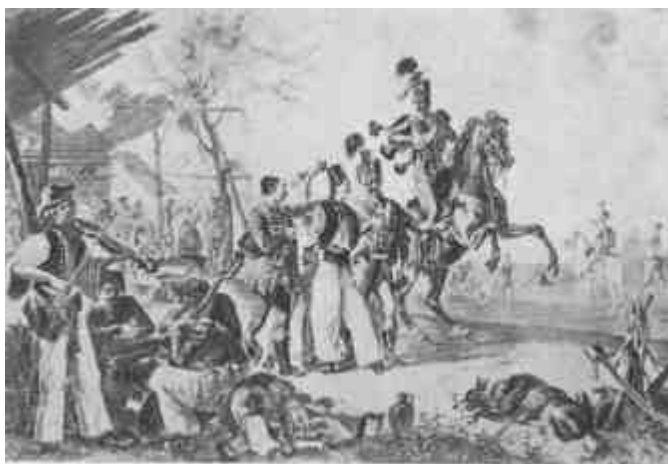
Huszártoborzás a XIX. század elején.