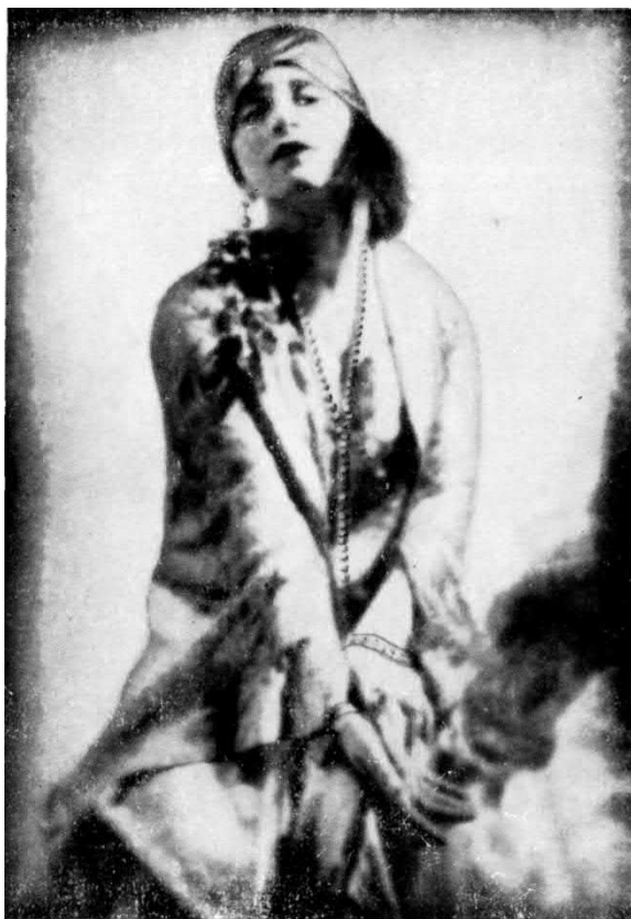
Lunacsarszky népbiztosné kincseket érő ékszereiről hasábokat irtak a genfi lapok, melyeknek felületes olvasó-táborát a népbiztosok fényüzése jobban érdekelte —