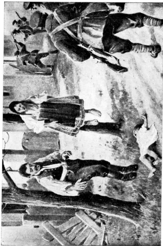
— mindenkor kifejezte a tanácskormány „háláját”,