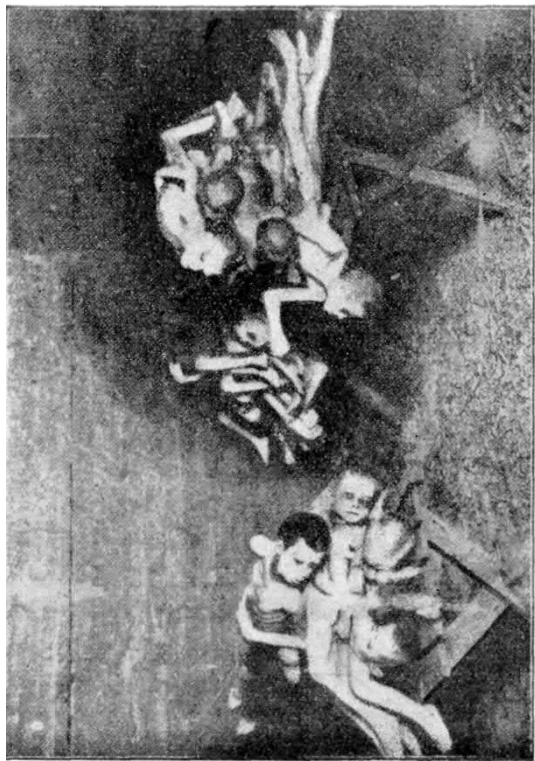
— mint a hihetetlen nyomor és a pincékben egymásra rakott éhenhalt orosz gyermekek tetemei.