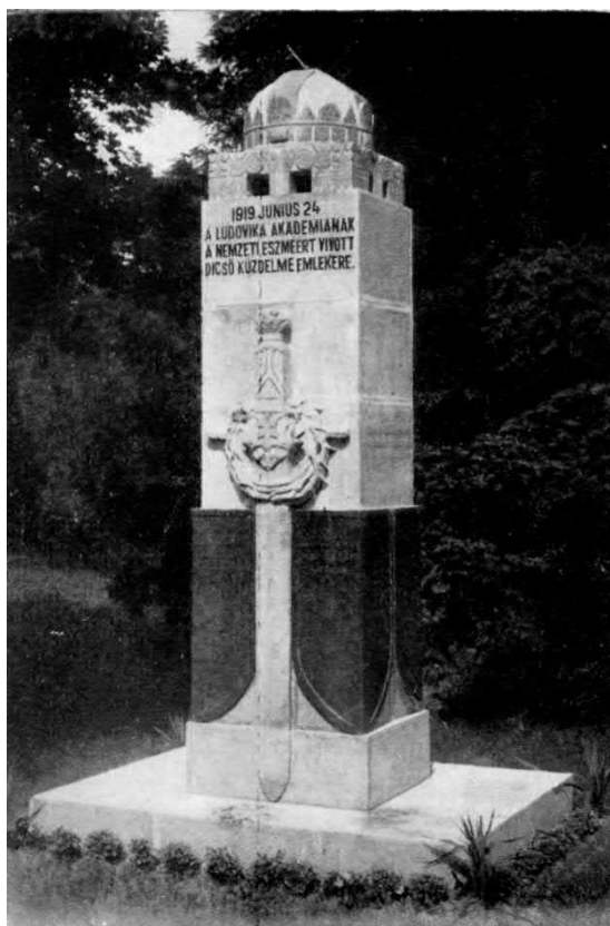
A Ludovika Akadémia emlékműve.