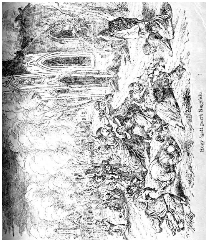
Hogy égett porrá Nagyfalú