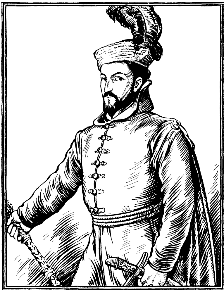
(RITRATTO DEL CARDIMALE IPPOLLITO DE MEDICI (TIZIANO) |