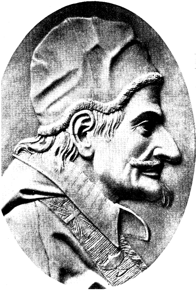
XI. INCE PÁPA.