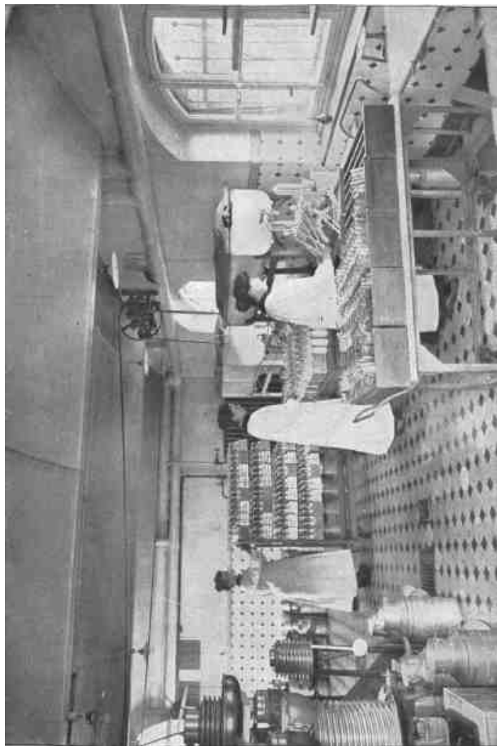
Tejespalackok töltése géppel.