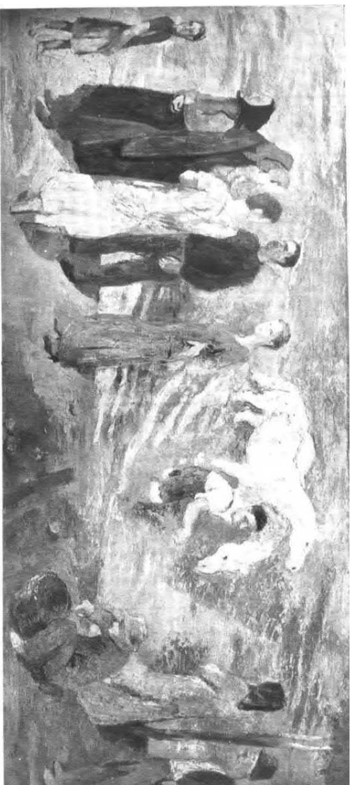
Szónyi István : Lófürderés. Tempera. (Radnai Béla tulajdona.)