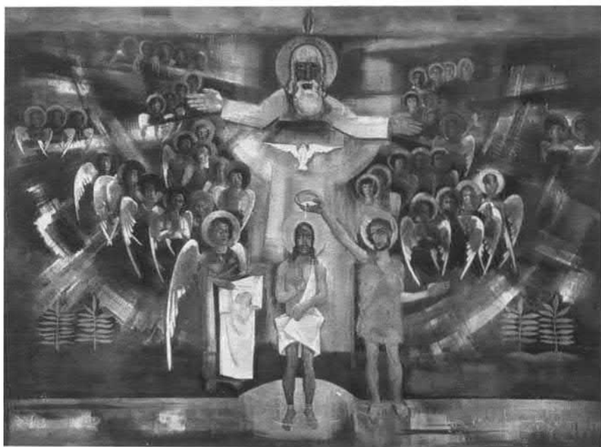
Aba-Novák Vilmos falképe. Szeged, Szent Demeter-torony.