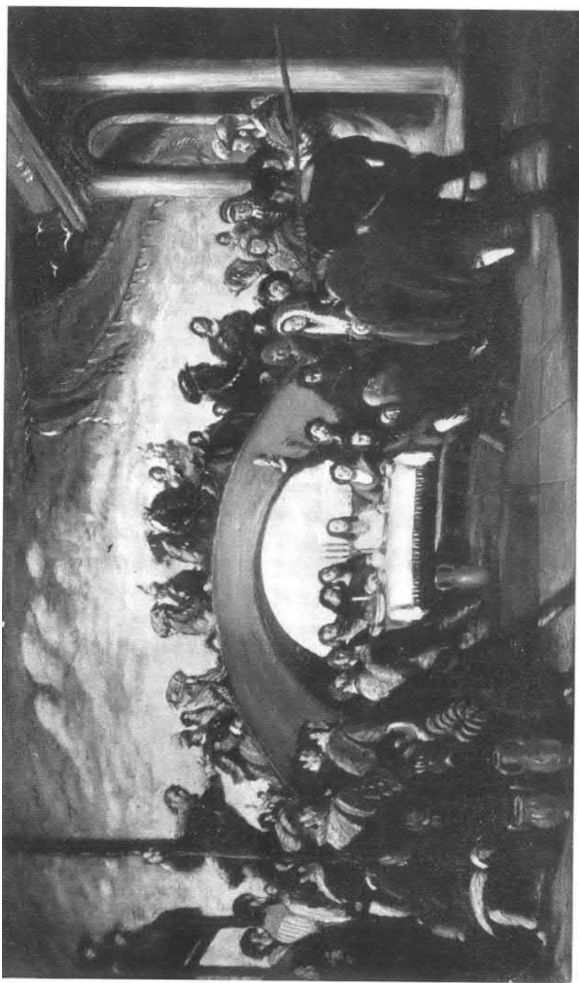
Mária megérkezik a kánai menvegőre