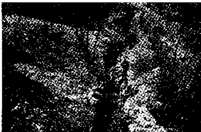
Állásunk egy részlete.

Az állásokat (1. és 2. vonalat) a zászlóalj maga építette ki s ez tekintettel a kizárólagos sziklatalajra és azon körülményre, hogy azokat az Isonzó