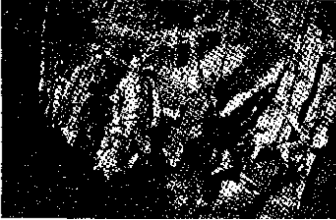
A balszárny századparancsnok kavernájának bejárata (VI. a.) megerősített oldalfalakkal. 1. Orosz Béla főhadnagy. 2. Csethe százados. 3. Krammer Hugó főhadnagy.

ebben a rettenetes zajban is külön megéreztek a 3 mázsás aknák irtózatos detonációját.