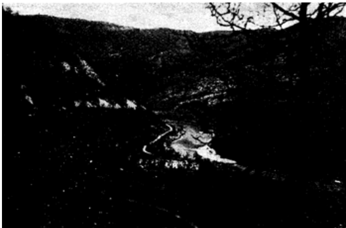
A kép baloldalán a Pláva-i hídfő 383 -/y magaslat. Az olasz állások a magaslat lábánál fekvő Globna község előtt az Isonzónál kezdődve a meredek magaslat oldalán húzódtak fel a tetőre.

saikkal. Itt fedetten nagyobb erőket hozhattak át erre az oldalra, mert a meredeken emelkedő hegy miatt ezeket a hidakat tűz alá venni nem lehetett. A hadi Hofer-jelentésekben említett Plavai hídfő alatt ezen 383. magaslat értendő.