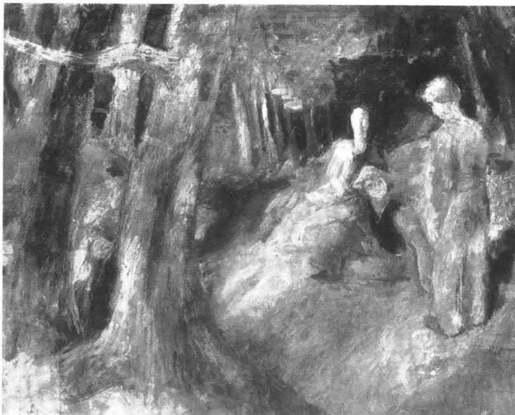
Szónyi István : Erdő mélyén.