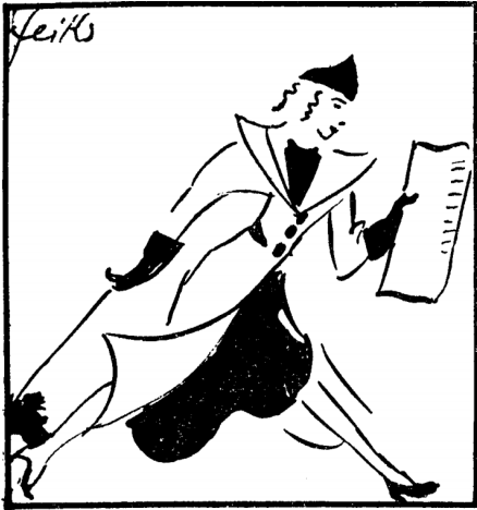
»Copier, c'est voler«

Mindezt a fejtörést, rajzolást, tervezést azonban a »grande couture« nagy konferenciája előzi meg. Ezen a konferencián a szabókirályok nemcsak azt döntenek el, milyen lesz az új szín, az új vonal, hanem azt is, melyik kisipart lendítsék fel az új szezonban. A gyöngyösöket boldogítsák csillogó strassz-ruhával, a paszományosokat zsinóros divattal, vagy a művirág-készítőket bő marga-