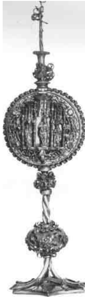
Csóktábla 1500-ból. (Magy. Nemzeti Múzeum)