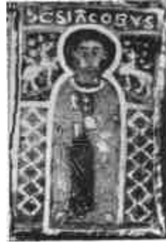
Részletek a Szent Korona Szt. István-kori felső feléből