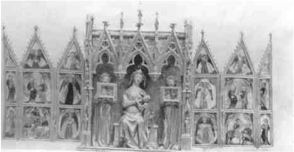
Zománcos ezüst szárnyasoltás (Fans, Rothschild-gyűjtemény a Louvrebán)