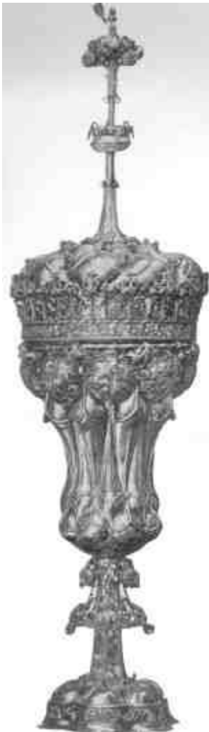
Mátyás király serlege (Bécsújhelyi városi múz.)