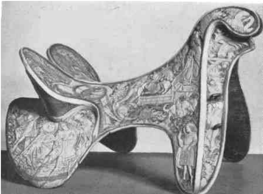
Dísznyereg csontfaragásokkal a XV. század elejéről (Magyar Nemzeti Múzeum)