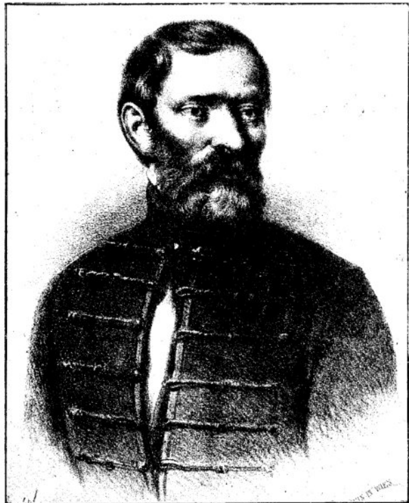
Debreczeni Márton, a „Kióvi csata” írója

a következő darabokban aratott nagy sikert s ünnepezték a nagy művész nejét: április hó 28-án: Lecouvreur Adrienne, május hd 1-én Dalma Jókai Mór drámája, május hd 5-én Schiller Stuart Mária, május hó 8-án Jósika Miklós: Két Barcsai, május hó 10-én a Koldus nő, francia dráma, május hd 12-én Szőrei Agnes dráma 5 felvonásban, május hd 19-én Corneille Cidje, 19-én Donna Diana, május hd 22-én Angolul, vígjáték Krönertől, Színésznő, vígjáték egy felvonásban, 23-án Cid másodszer, 24-én ugyanaz mint 21-én, május 28-án Lady Tartuffe jutalomjátékul. Koszorúk, üdvözlések. 29-én Szapári Péter.