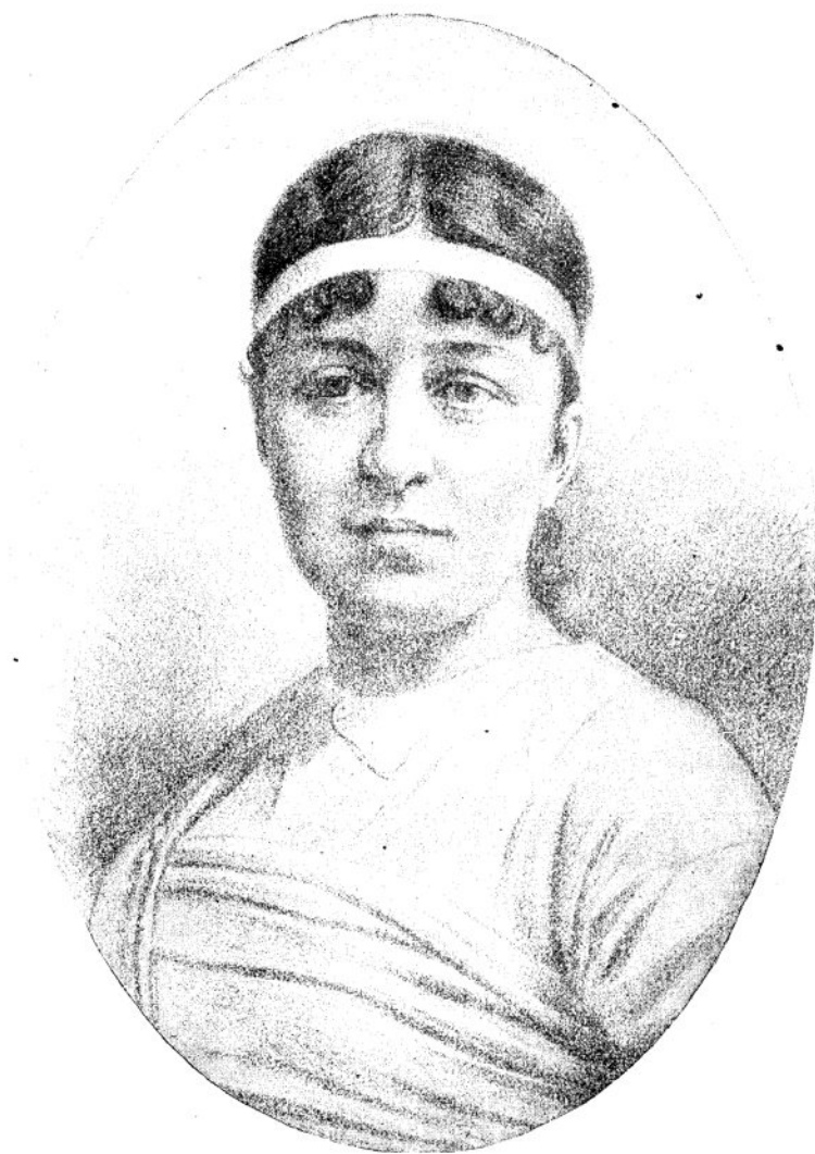
„Kassainé“ akiből Jászai Mari néven Európa legnagyobb tragikája lett