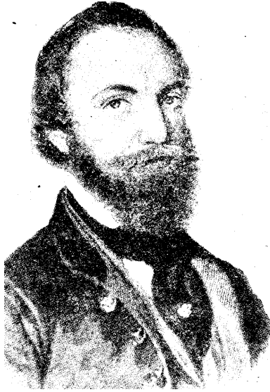
Jókai a hatvanas-hetvenes években

— Szeretett ifjú barátaim! Drága előttem minden levele a babérnak, mit a munkásság bármely terén tett csekély szolgálatomért nekem ajánlanak: de egy sem oly kedves, mint az, melyet a költészetért kapok. Azért bocsássa meg nekem nemzetem, ha most ahelyett, hogy a képviselőházban helyemen az okos és szakértő beszédek hallgatnám, most idejöttem, hogy én beszéljek. Amennyire tisztelettel meghajlok a reális előtt s amennyire elismerem, hogy a tudomány s az anyagi fejlődés előmozdítója a jólétnek s a külső boldogságnak, amennyire hangsúlyozom, hogy az ipar adja meg a szükséges húst és kenyeret, annyira követelem elismerését annak, mikép a lelket csak a költészet adja. A költészet adja a hazaszeretetet, abban koncentrálódik minden poézis. A hazaszeretet pedig mindenek fölött való. Azért gondoltam, hogy lejövetellemmel talán elérek némi hasznot