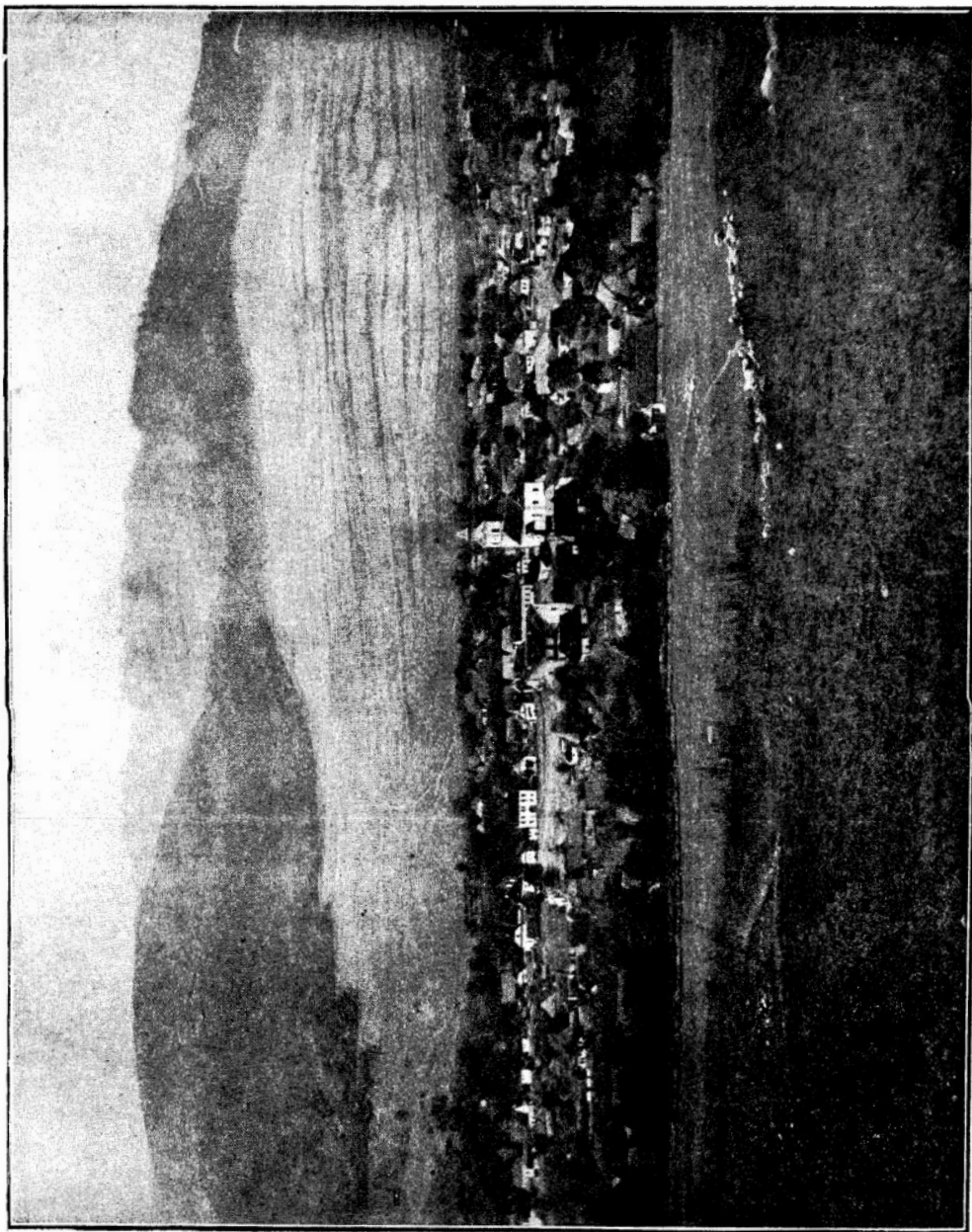
Torockó lát képe a Tílalmassal és az Ordaskővel