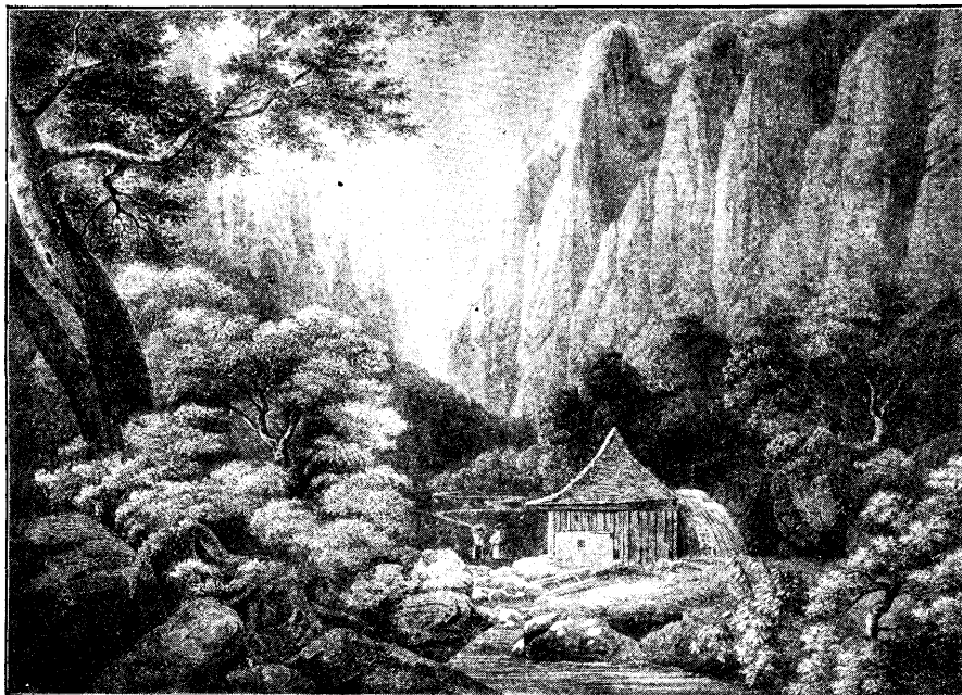
A tordai hasadék