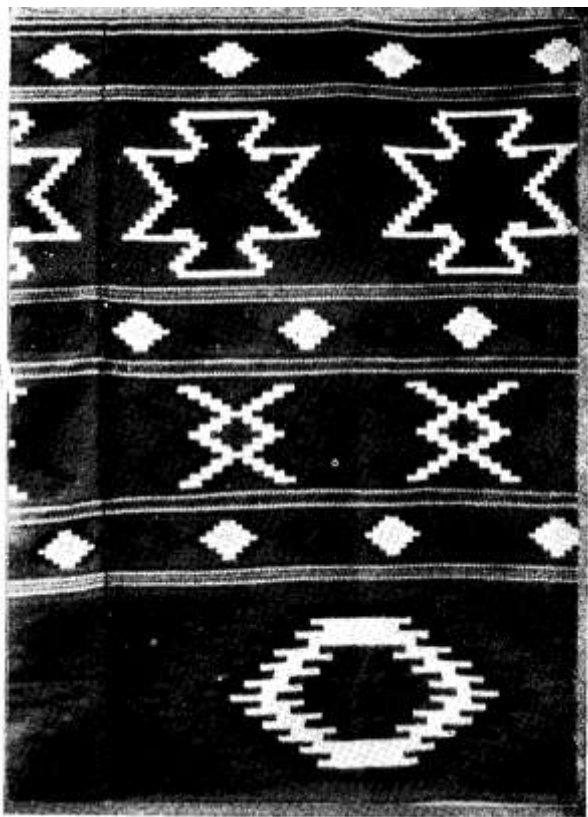
KILINSZÖNYEG, KIS-ÁZSIA, XIX. SZ.

Közölte az Áll. Nőipariskola szerkesztésében megjelenő „Muskátli” kézimunkatújság- 1934 jan. száma. Közlés a szerkesztőség engedélyével.