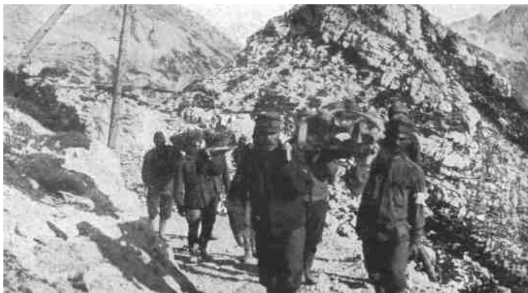
SEBESÜLTEK SZÁLLÍTÁSA A KARSZTON.