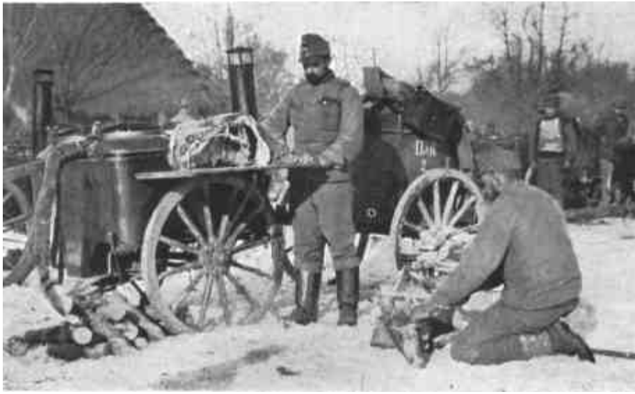
OSZTRÁK-MAGYAR KONYHAKOCSI K