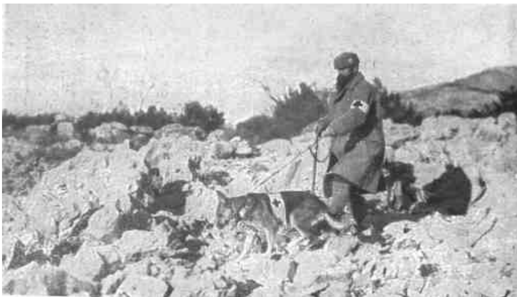
SEBESÜLTIVŐNK A KARSZTON KUTYÁVAL KUTAT A SEBESÜLTEK UTÁN.