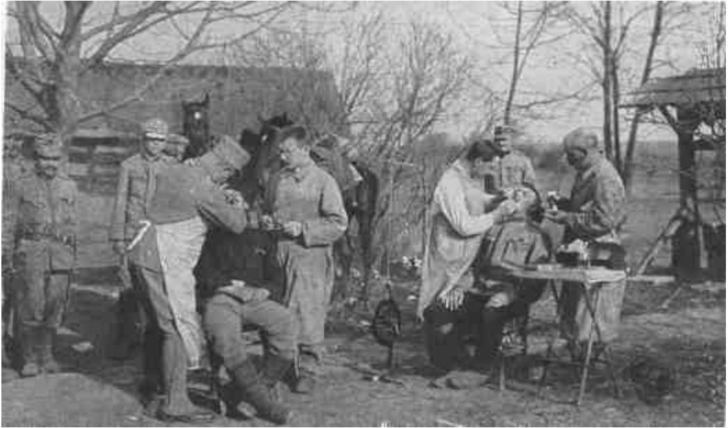
OSZTRÁK-MAGYAR TÁBORI FOGÁSZAT.