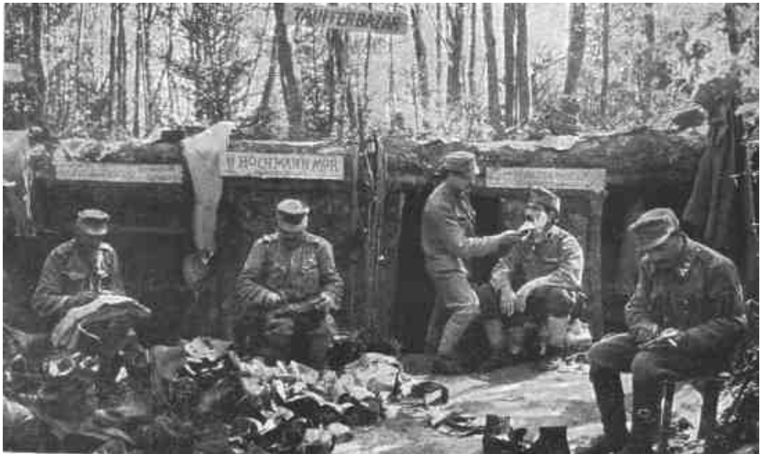
MESTEREMBEREINK A HARCIVONAL MÖGÖTT AZ OROSZ HARC TÉREN