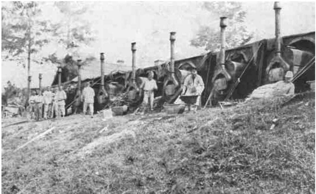
OSZTRÁK-MAGYAR TÁBORI KENYÉRSÜTŐDE.