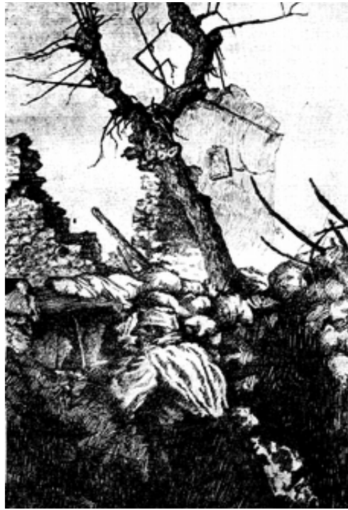
Nova Vas temploma