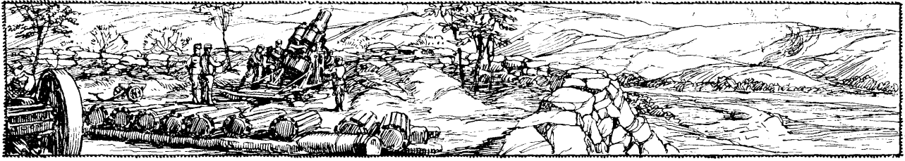
Helbing Ferenc eredeti rajza.