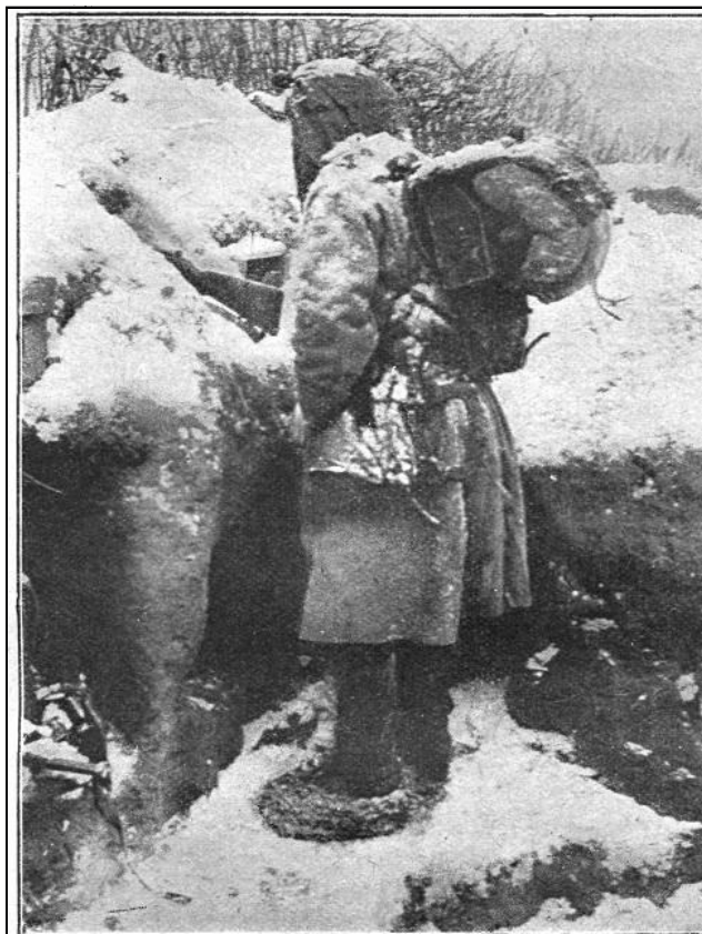
Előőrsünk Orosz-Lengyelországban 1914 végén.

Mielőtt azonban ezekre az 1915. év első negyedében elkövetkezett döntő eseményekre térnénk, meg kell rajzolnunk az északi harctér azon eseményeinek képét, amelyek a két nagy összecsapást közvetlenül megelőzték