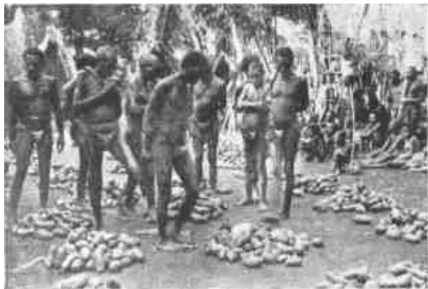
Ábrák „A természeti népek lélektana” c. dolgozathoz.