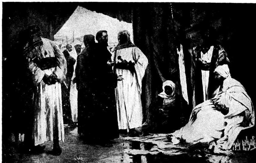
SZENT FERENC A SZULTÁN ELŐTT