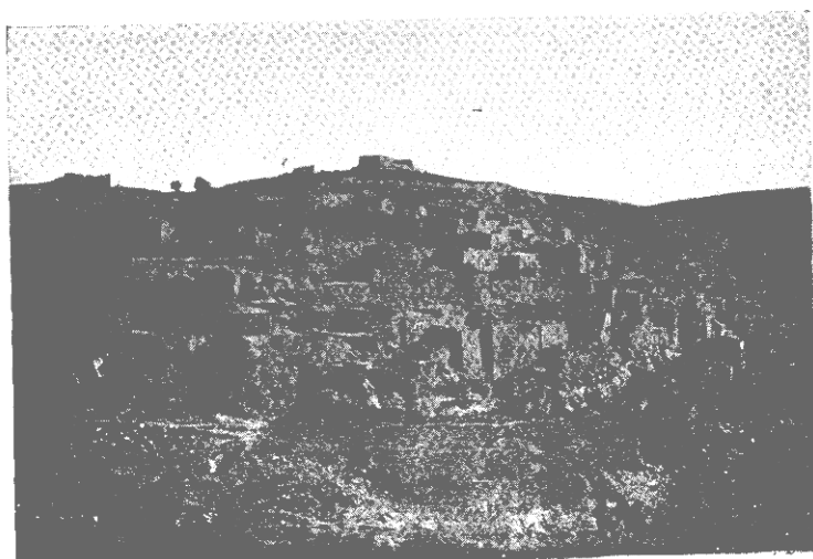
KEFR SILOAN (a botrányok hegye)