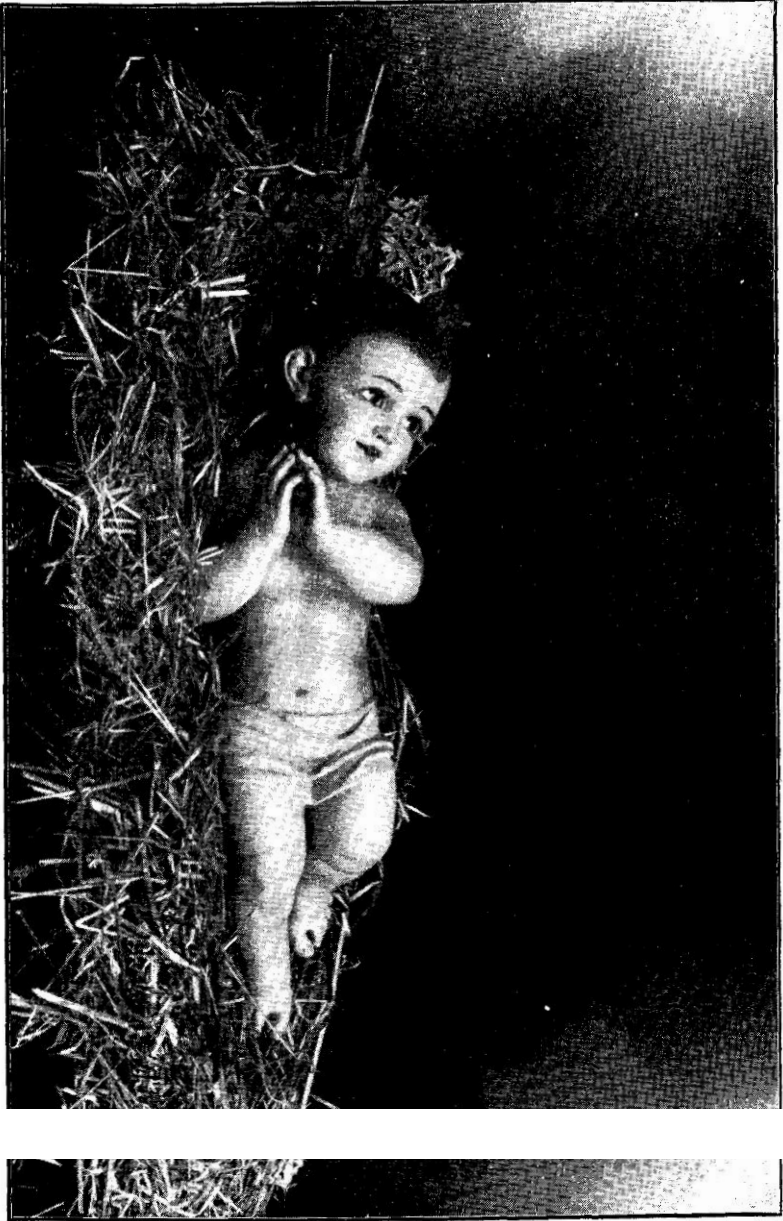
A BETHLEHEM KISDED