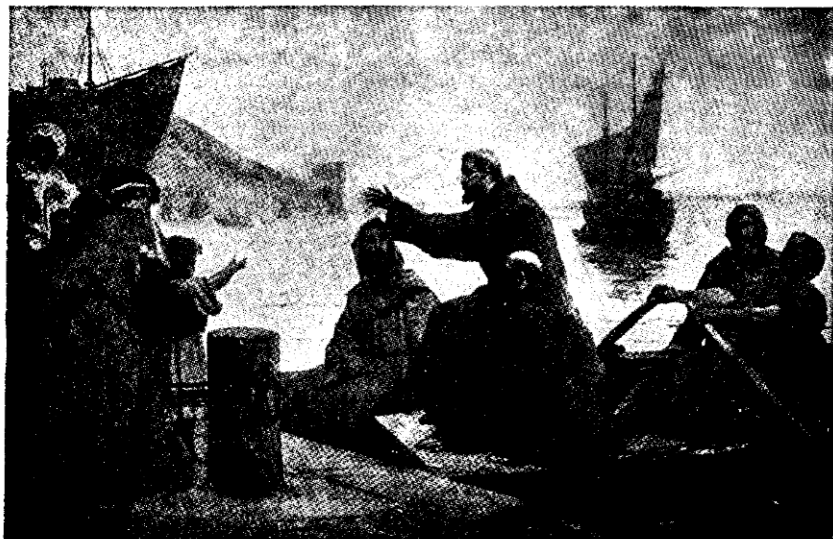
SZENT FERENC ANCONÁBAN HAJÓRA SZÁLL