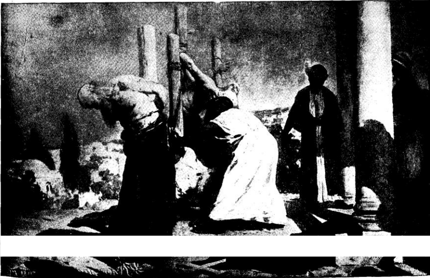
A SZENTFÖLD FERENCES VÉRTANUI