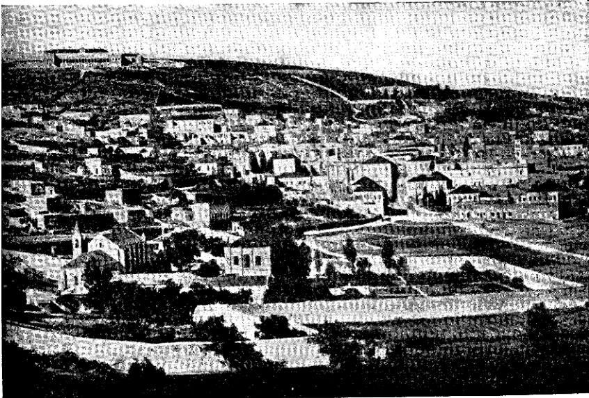
NÁZÁRET LÁTKÉPE a hegycsúcson a szaléziánusok intézete: „az ifjú Jézushoz“