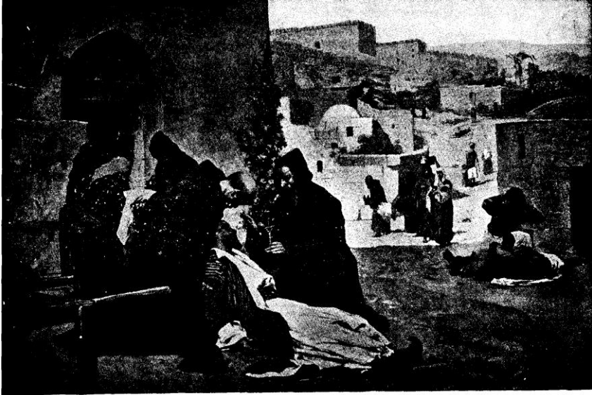
FERENCESEK ÁPOLJÁK SZENTFÖLDÖN A BÉLPOKLOSOKAT