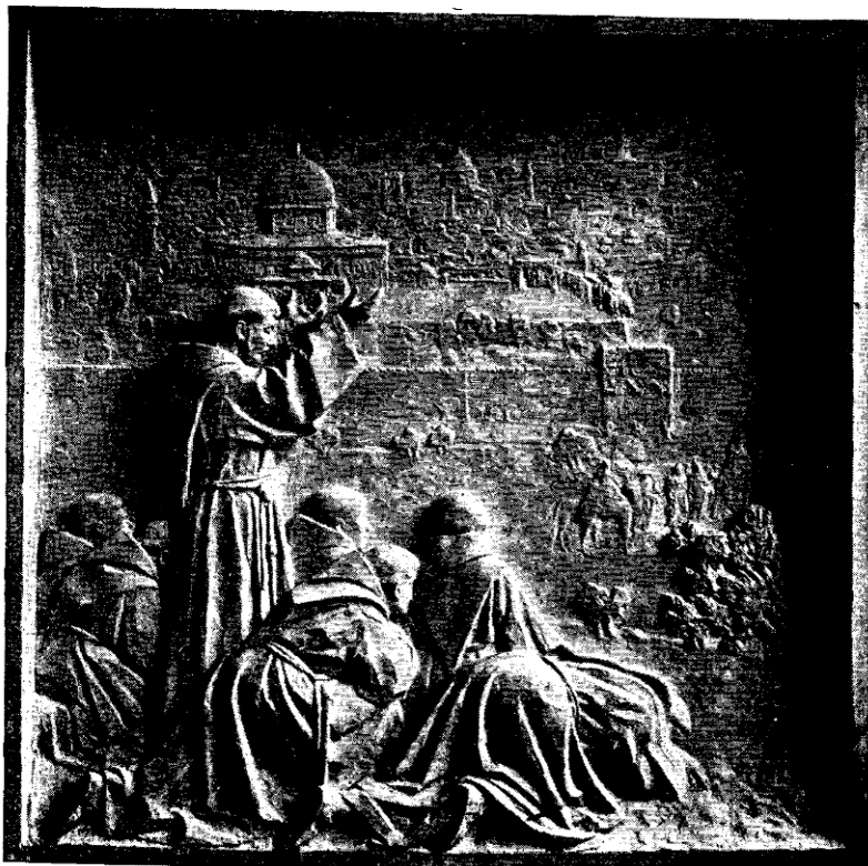
SZENT FERENC TÁRSAIVAL JERUZSÁLEM ELŐTT