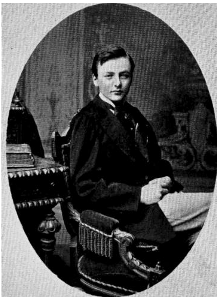
TISZA ISTVÁN DEBRECENI JOGÁSZ KORÁBAN.