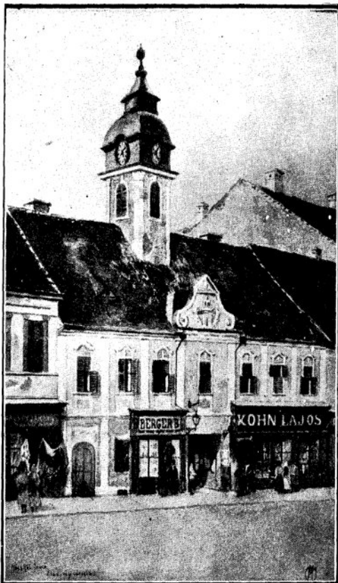
A régi aradi városháza

A hol az ólommal való „plombálás” veszedelme kísértett és mindenki az athéni bírák halálra szóló lyukasztott céduláját szorongatta markában, északról az orosz, délről az osztrák vasölelése között Jókai most ott ül a történelem maszatos műhelyében. Soha ilyen közélről nem érezte forrd lélegzetét. Nem csoda, ha közel volt az észvesztéshez. Együtt lakott Nyáry Pállal. Szobájuk Csányi László közlekedési miniszter két fülkés szállására nyílt és a nemes öreg kis lakásában volt az összminisztérium, mely izzott az utolsó munkától és rajzott, mint a méhkas. Szomszédjuk volt az elegáns Kiss Ernő tábornok. Emelettel feljebb húzódik meg a vezérkar és lakott Görgei, ki aug. hó 10-én