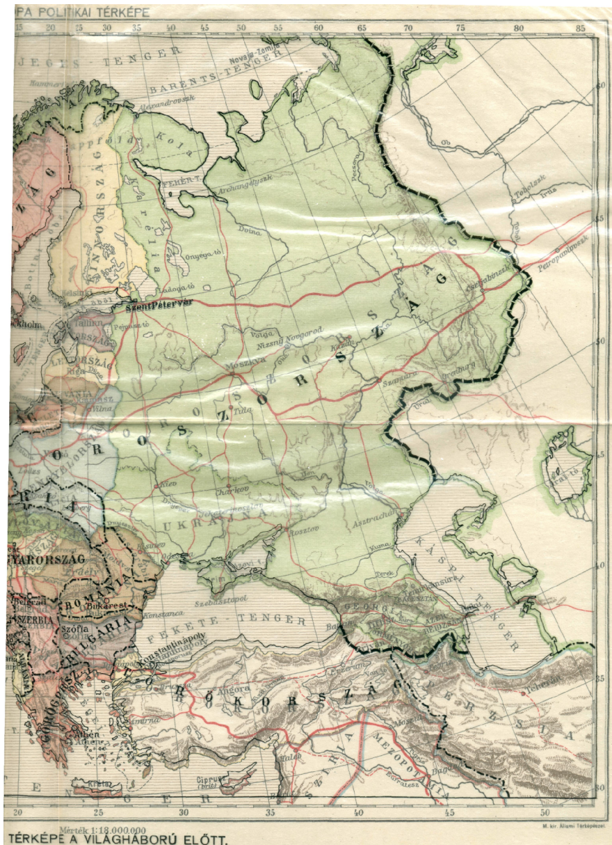
Mérték 1:13.000.000 TÉRKÉPE A VILÁGHÁBORÚ ELŐTT.