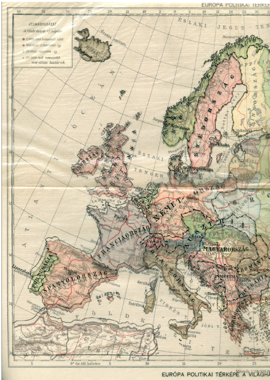
EUROPA POLITIKAI TÉRKEPE A VILÁGBAN