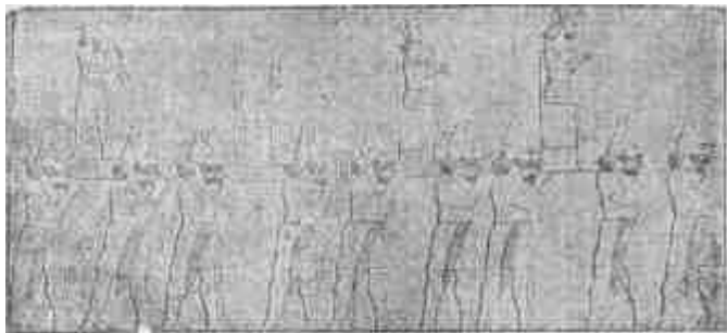
Körmenet a bálványokkal.

Kis kötetünkben nem adhatunk rendszeres és