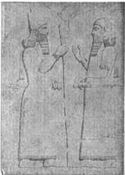
Szargon király és hadvezére.

Akki nevű vízöntőzöhöz kerül, aki fölneveli. Előbb kertész lesz b;lole, később pedig a király pohárnoka. Mint ilyen kerül Akkád trónjára. Néhány feljegyzés szerint Szarukin az első szémi uralkodó, aki fajtestvéreinek „a fekete fejűeknek” uralmát egész Mezopotámiában állandósítani akarta.