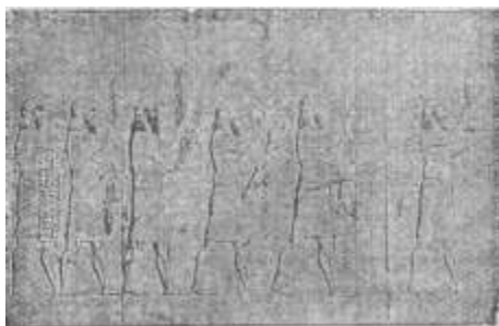
A királyi lakoma felszolgálása.

A harmadik fontos forrásunk is egykori föl- jegyzésekből áll.