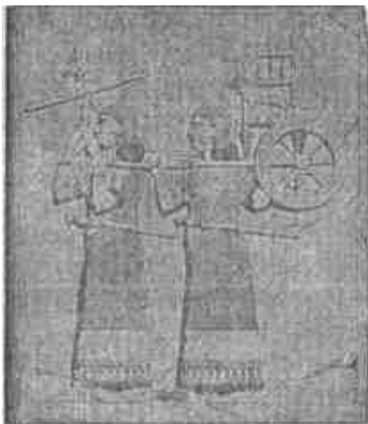
Királyi kocsit vivő apródok.

Kr. e. 1746-ban a hatti pusztítás által gazdátlanná vált városokat a kassuk szállják meg s Gandás nevű királyukat Babilon trónjára ültetik. Félezer esztendeig