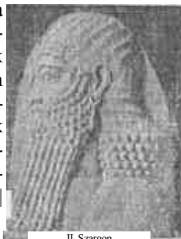
II. Szargon vezérkari tisztje.

Az összevetésekből nyert biztos adatok azt mutatják, hogy a szémíták a szumir nép közé telepednek s századokon keresztül velük élve, részesei lesznek a szumir kultúrának. Mikor aztán annyira megszorodtak, hogy uralmukhoz meg volt a megfelelő faji tömegező, lassankint egyre több várost kerítenek hatalmukba, míg végre egészen úrrá lesznek a folyam közön. Évezredek harcok ezek, melyeknek részleteiből bár csak egyetmást tudunk, meglátjuk a szumirság élet-halál harcát az élősi fajtával szemben.