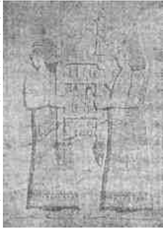
Királyi trónt vivő apródok.

A mezopotámiai városok majdnem mindenikének éppen úgy volt egy különös tiszteletnek örvendő istensége, mint város királya. Említettük már, hogy ezek a város királyok túlnyomó részükben papi fejedelmek is voltak. A helyi istenségek egy részét a többi városokban is tisztelték. A hegemoniára törekvés következményének is tulajdonítható az az érdekes jelenség, hogy