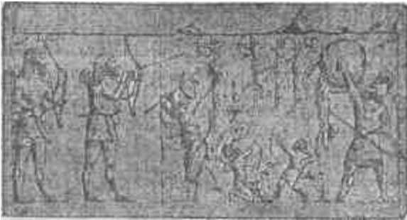
Asszíriai nyilas és lándzsás katonák.

Sem az egyiptomi képírást (hieroglif) nem ösmerte a mai kor, sem azős egyiptomiak nyelvét. Hogy sikerült megfejteni, az annak a véletlennek köszönhető, hogy találtak egy olyan követet, melyen a felírt szöveg görög nyelven is megvolt. Ennek a feliratnak az alap-