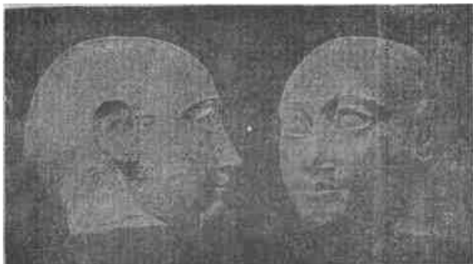
Szumir papi fejedelem feje.

A szumirok turáni voltának döntő bizonyító kait röviden ideiktatjuk, mert éppen magyar részről dobták be újra a kételkedés mérgező mételyét a magyar köztudatba. Hiba ne essék szavamban, a szumir kérdéssel