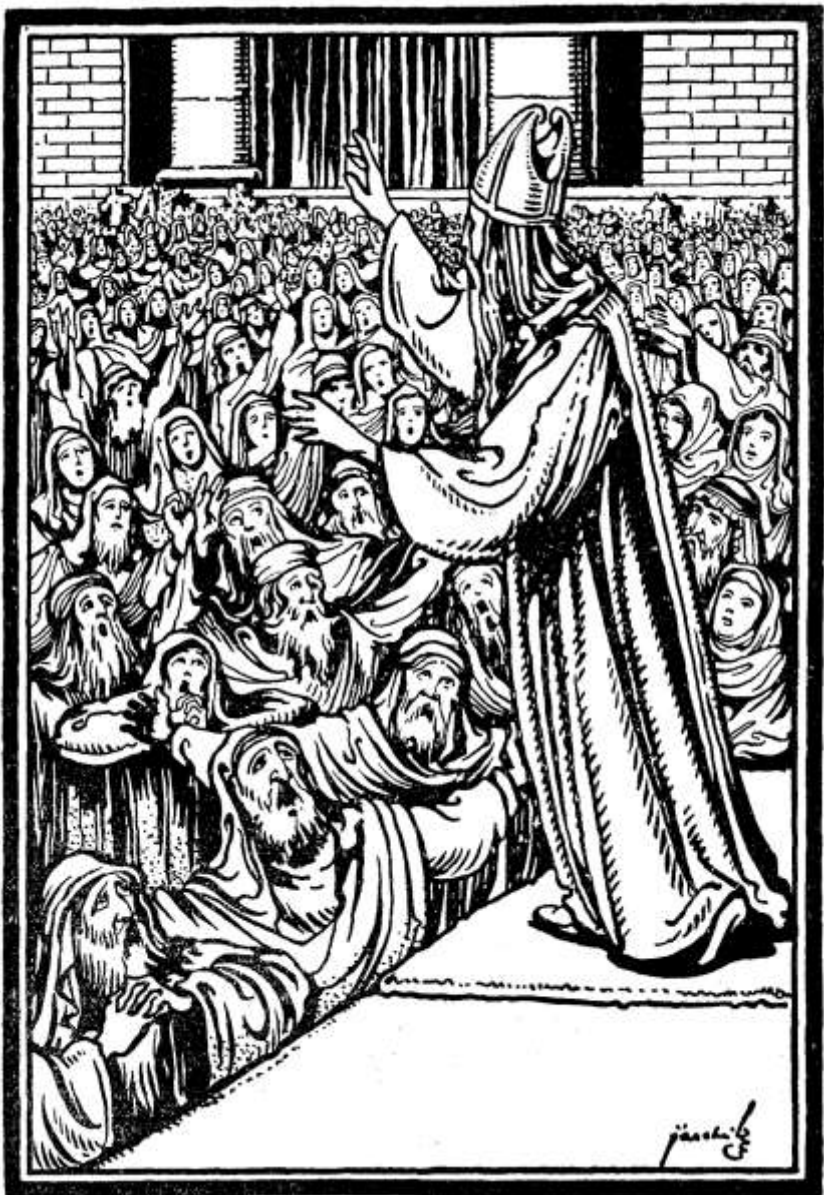
A jeruzsálemi templom előtt a tömeg várja Zakariás áldását.