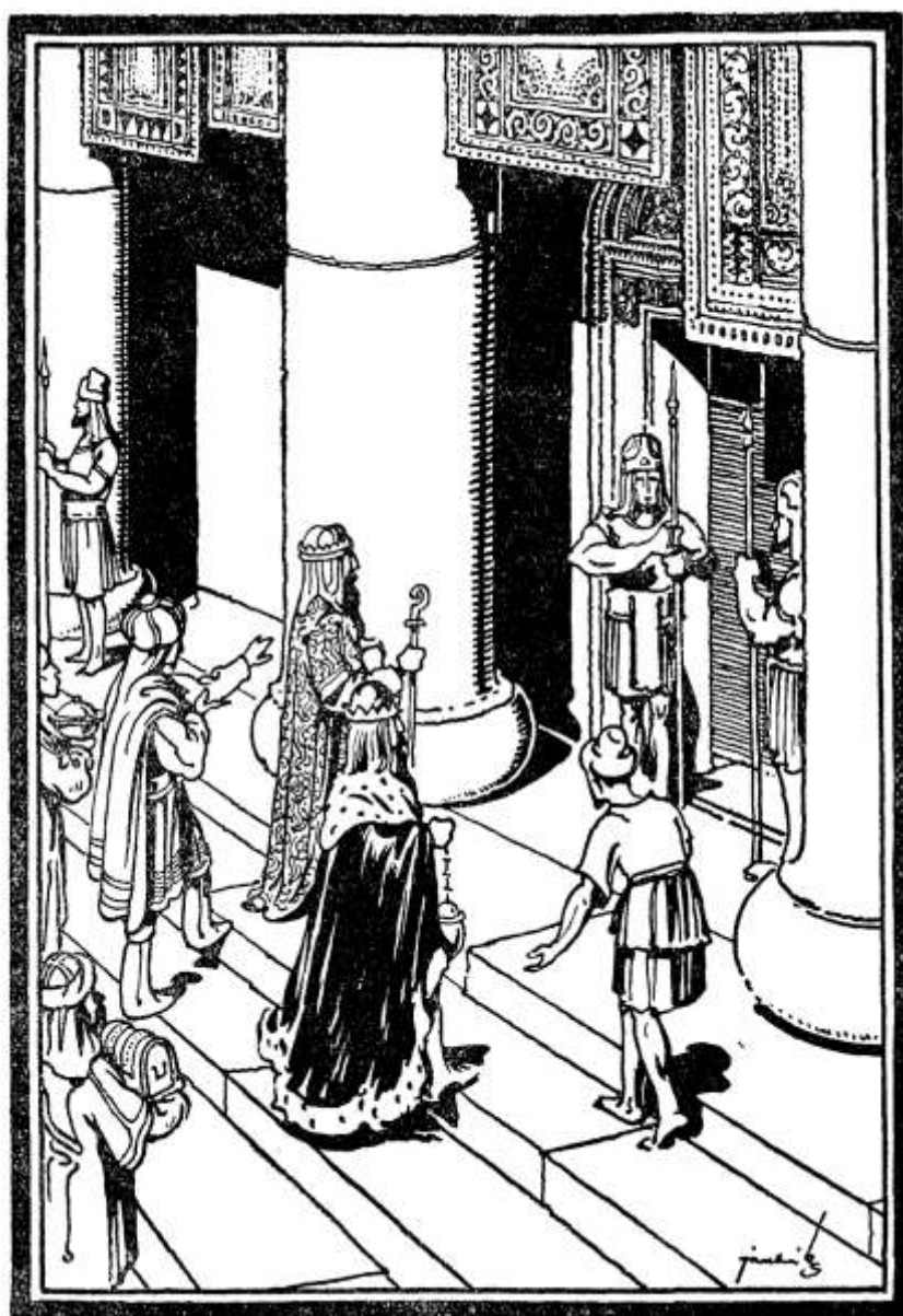
A három király