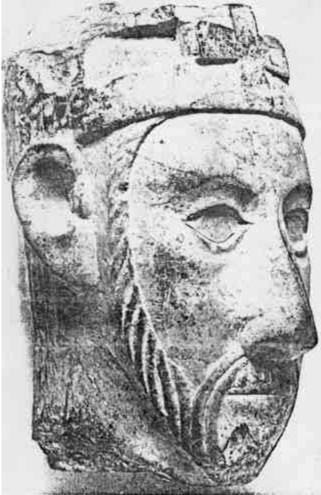
VÖRÖSMÁRVÁNY KIRÁLYFEJ A KALOCSAI SZÉKESEGYHÁZ KAPUPÉLLETÉRŐL. BUDAPEST. M. NEMZETI MÚZEUM.