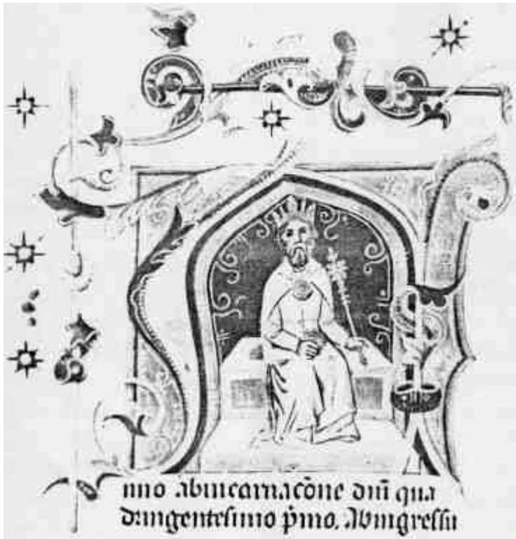
ATTILA ALAKJA A KÉPES KRÓNIKÁBAN. BUDAPEST, M. NEMZETI MÚZEUM.