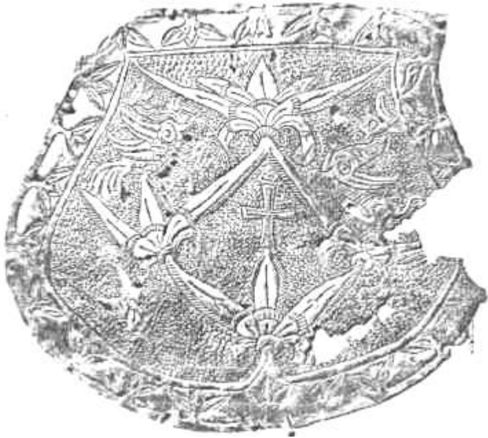
HONFOGLALÁSKORI TARSOLYLEMEZ BEZÉDRŐL. BUDAPEST, M. NEMZETI MÚZEUM.