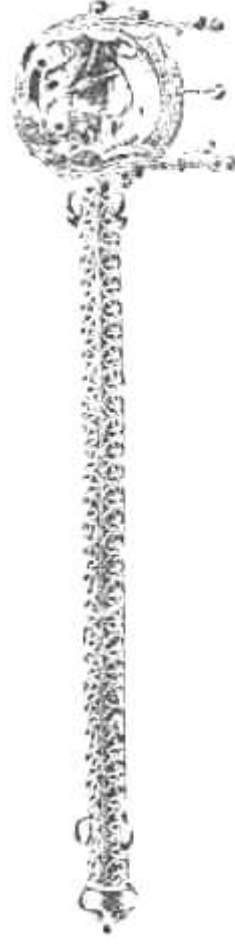
JÓLAI. KELETTI KRISZTÁNGÖMBEL MEGYVÁRI FÜGLALAVAS NEM. SZÁZADI. HIDVÁRESEI, KIRÁLYI VÁR.