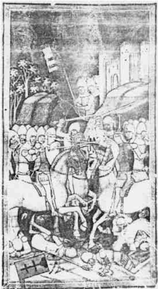
CSÁK MÁTÉ LEGYŐZÉSE RÜZGONYXÁL 1312 A KÉPES KRÓMKÁBÓL. BUDAPEST, M. NEMZETI MÚZEUM.