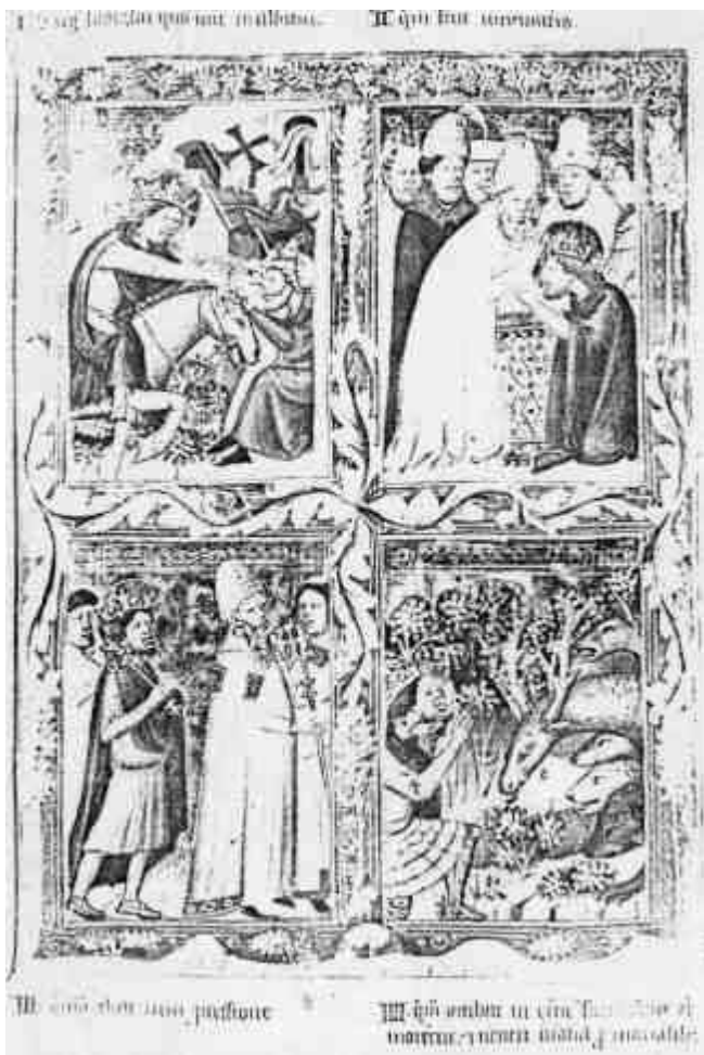
A Vatikáni Magyar Legendárium egyik lapja. 1. Szent László székesehérvárott. 2. Koronázása. 3. Kormányában. 4. Imájára vadállatok gyűlnek. Róma, Vatikán Könyvtár.