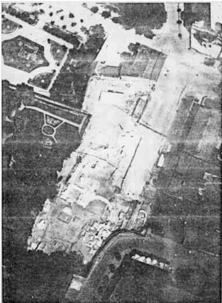
A SZÉKESFEHÉRVÁRI KORONÁZÓ SZÉKESEGYHÁZ 1937-BEN FELTÁRT ALAPFALAI. LÉGI FELVÉTEL.