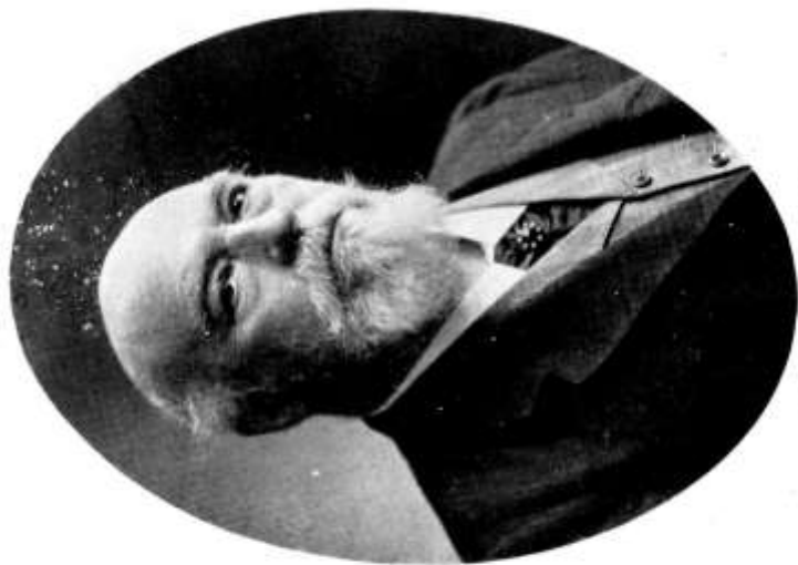
Darányi Ignác, 1920,