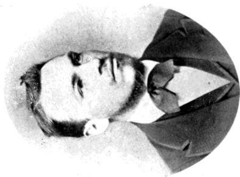
Darányi Ignác, 1872.