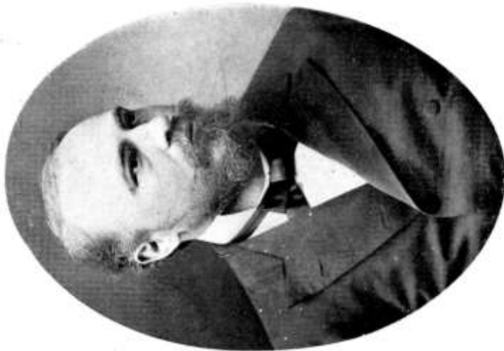
Darányi Ignác, 1880,