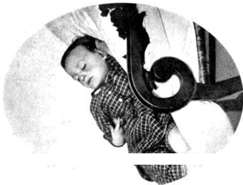
Darányi Ignác, 1850.