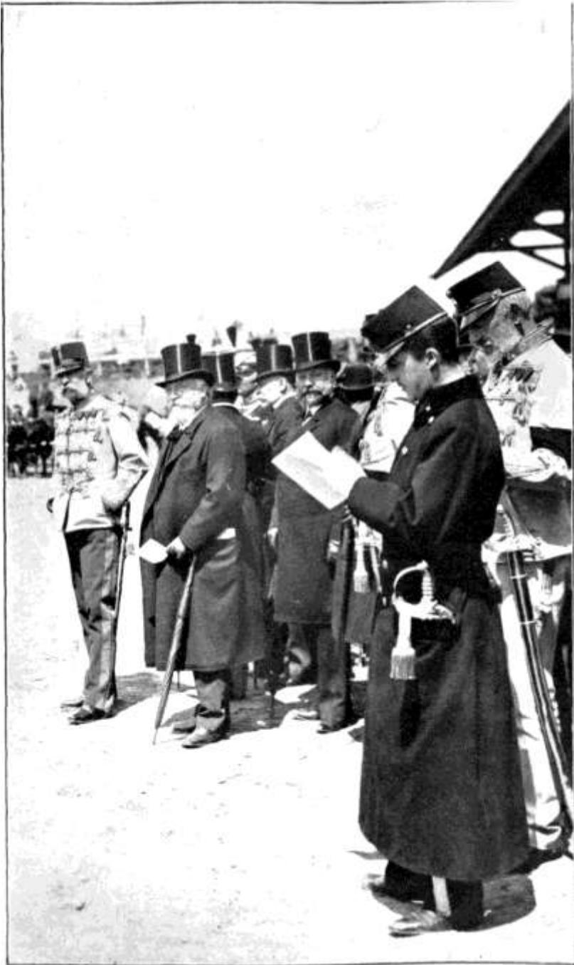
Darányi Ignác I. Ferenc Józseffel a lóversenyen, 1898. (Jobbszélien József kir. herceg [a mai tábornagy] és édesatyja.)