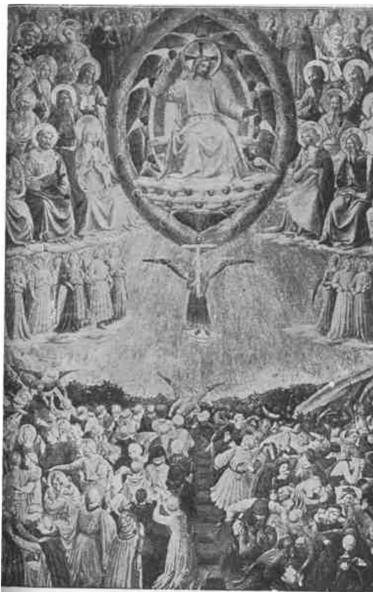
Bíró (Rex tremendae majestatis)