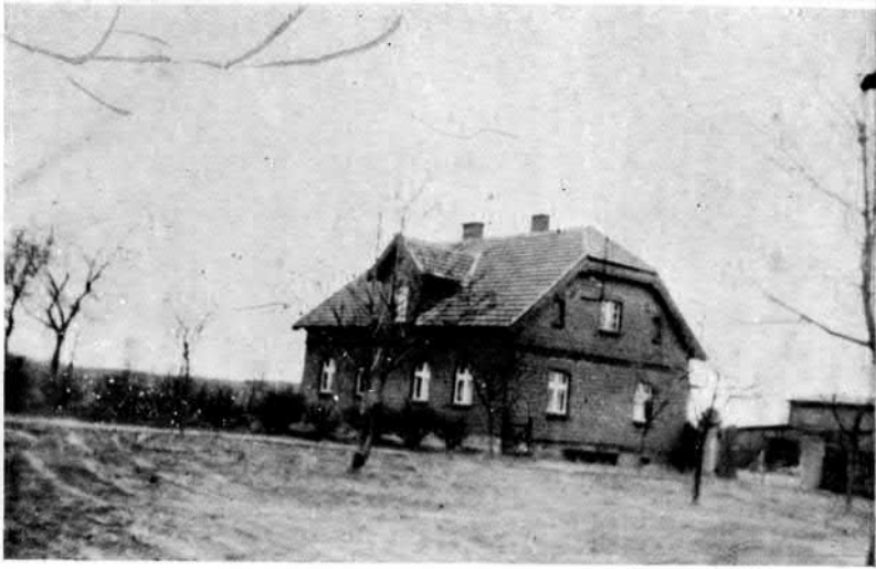
1. ábra. Telepes tanya a keletporoszországi Deutsch-Eylau mellett.