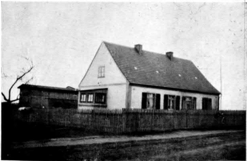
2. ábra. Telepes tanya az alsó-sziléziai Lampersdorf-ban.