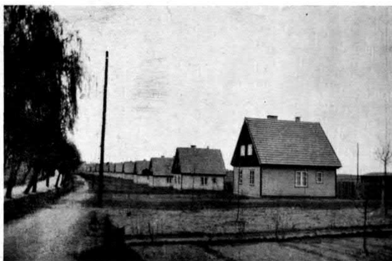
8. ábra. Faházakból álló városszéli telep Deutsch-Eylau mellett.