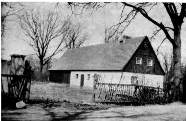
3. ábra. Telepes-ház a Boroszló melletti Oberhof-ban.