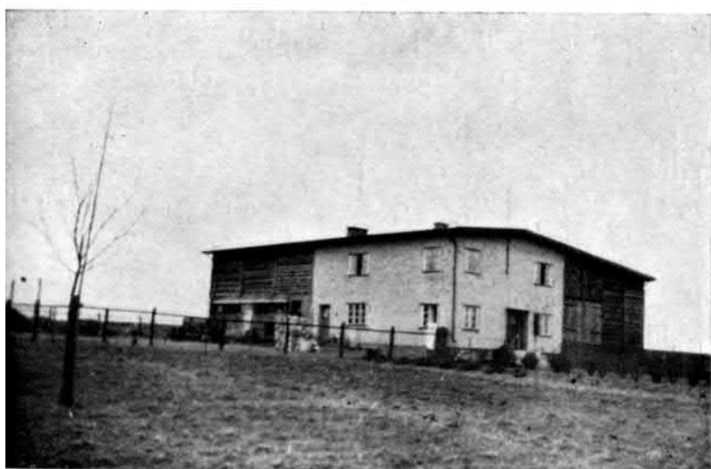
4. ábra. Stilszerűtlen telepes tanya a keletporoszországi Neudorf-ban.