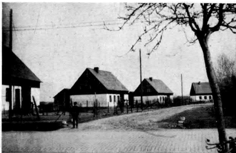
7. ábra. Munkás-telepes házak az alsó-sziléziai Deischlau-ban, müút mellett.