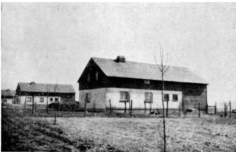
5. ábra. Telepes tanyák sora az alsósziléziai Gross-Weigelsdorf-ban.