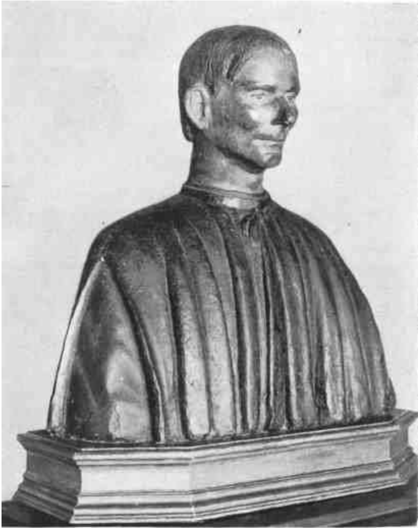
MACHIAVELLI. Firenze, Palazzo Vecchio.)