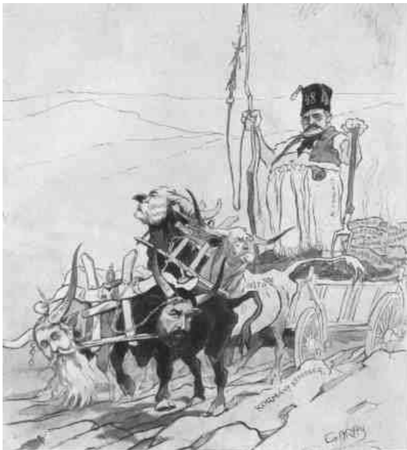
GARAY ÁKOS rajza.

A független sági pari program-kazaljával terhelt szekeret nehéz Kossuth Ferencnek a koalíció alatt a kormányképesség országútján húzatni a heves pártvezérekkel, akiknek mindegyike másfelé néz és mást akar.