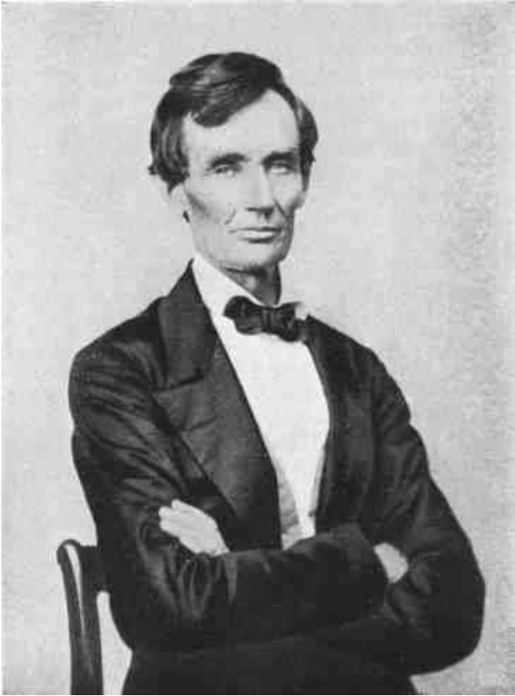
Abraham Lincoln .