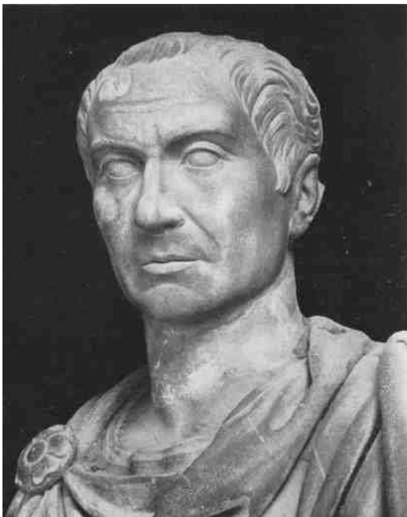
Julius Caesar. (Roma. Palazzo dei Conservatori.)