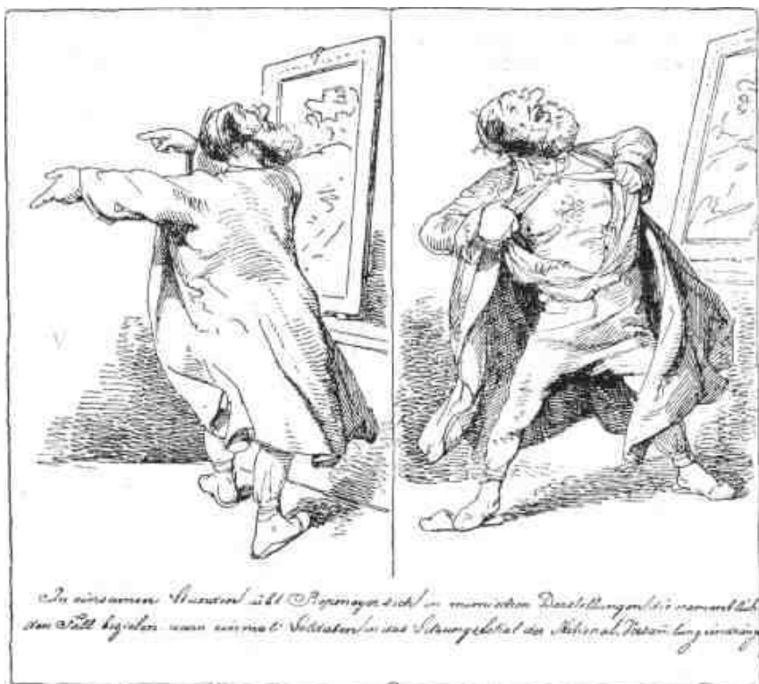
A demokratikus szájhősködés gúnyrajza 1848-ból: a frankfurti alkotmányozó nemzetgyűlés baloldali képviselője, Piepmeyer, a tükörben mimikai gyakorlatokat végez (1. kép), különösen arra az esetre, ha katonák rontanak be a nemzetgyűlés termébe (2. kép).