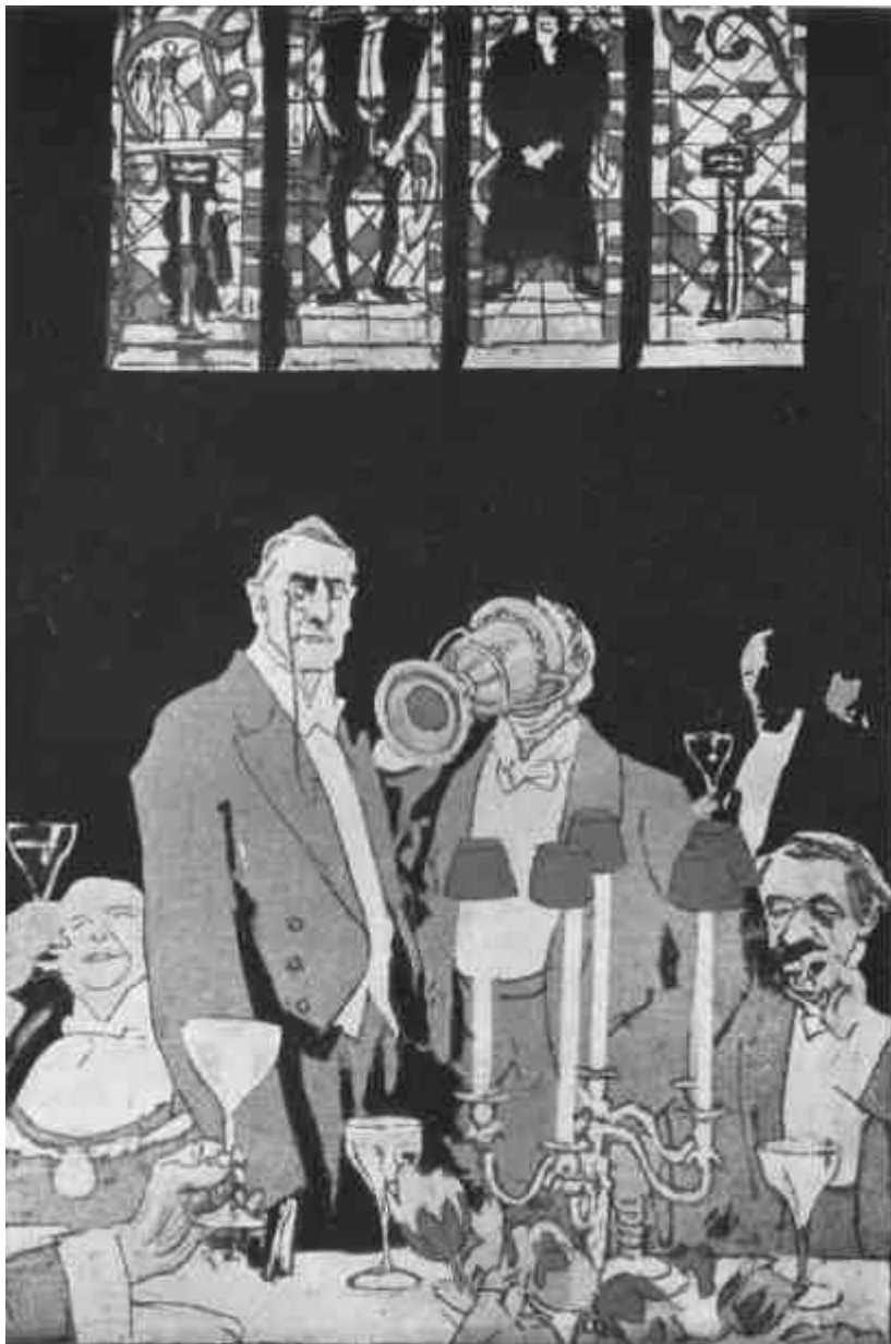
Guildhall banquet. (A. Chamberlain, Briand stb.)

»Mi diplomaták nagyszerűen tudnánk dolgozni, csak ne volna az a világtörténelem!« (Simplicissimus.)