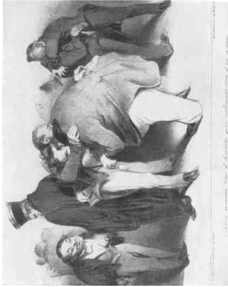
Hosoné DAUMON : Valamennyien becsületös emberek vagyunk, csókoljuk meg egymást!