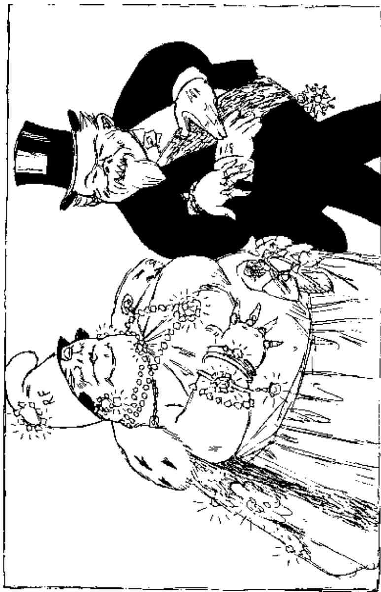
A Franciú Közlétség és Polgárá. Klauderitsche,