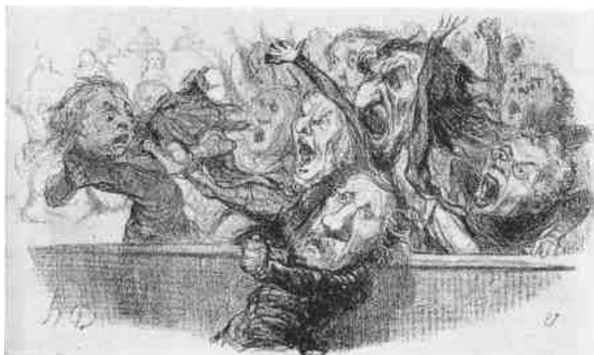
HONORE DAUMIER: Csend a Házban. – Vihar a Házban. (Az 1849-ik évi francia nemzetgyűlésből.)