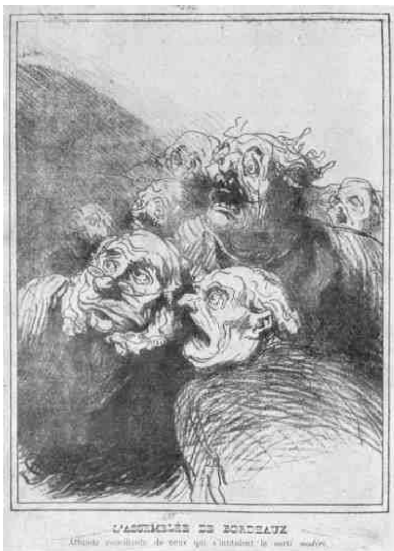
HONORE DAUMIER: A bordeaux-i nemzetgyűlés. 1871. (Aggresszív típus.)