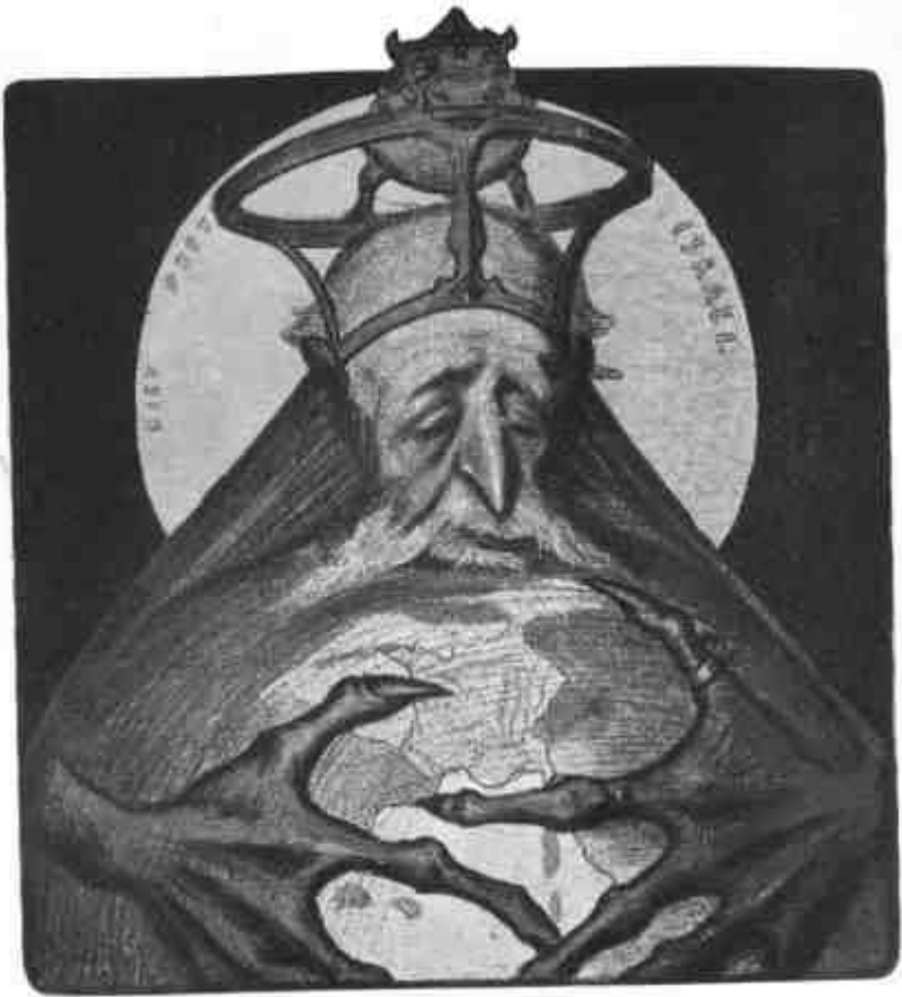
C. LEANDRE: Rothschild. (1898).