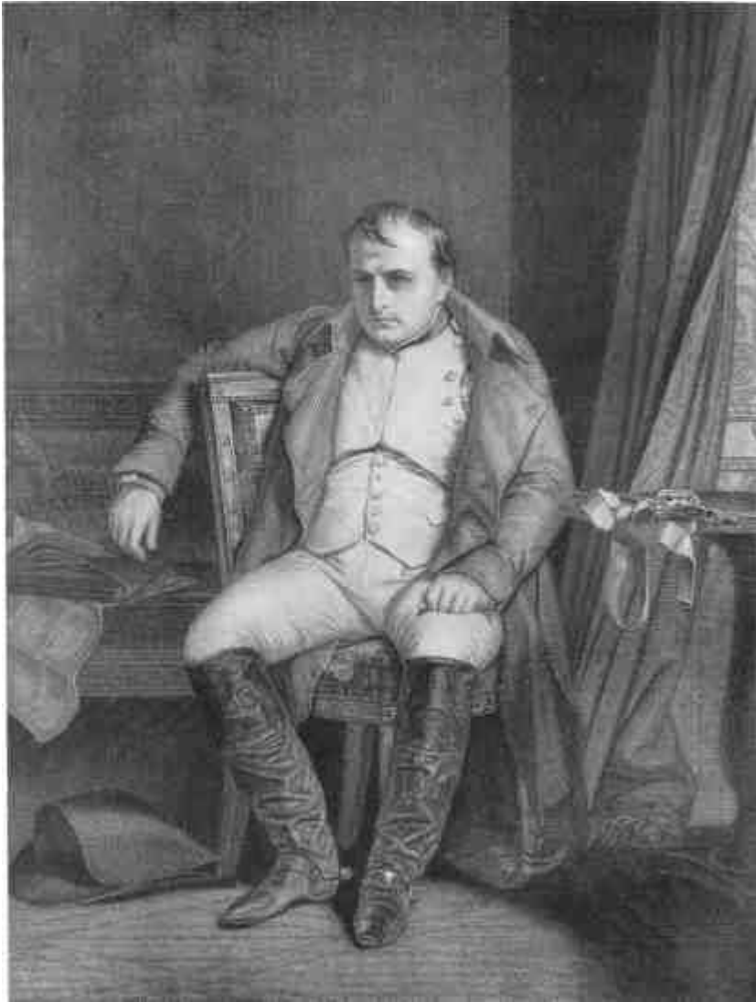
DELAROCHE: Napoleon Fontaineblauban 1814 marc. 31. (A kiábrándult államférfi.)