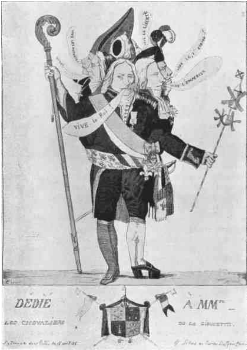
Talleyrand, a hatfejű ember, mint a szélkakasrend lovagja. (Gúnyrajz 1815-ből.)