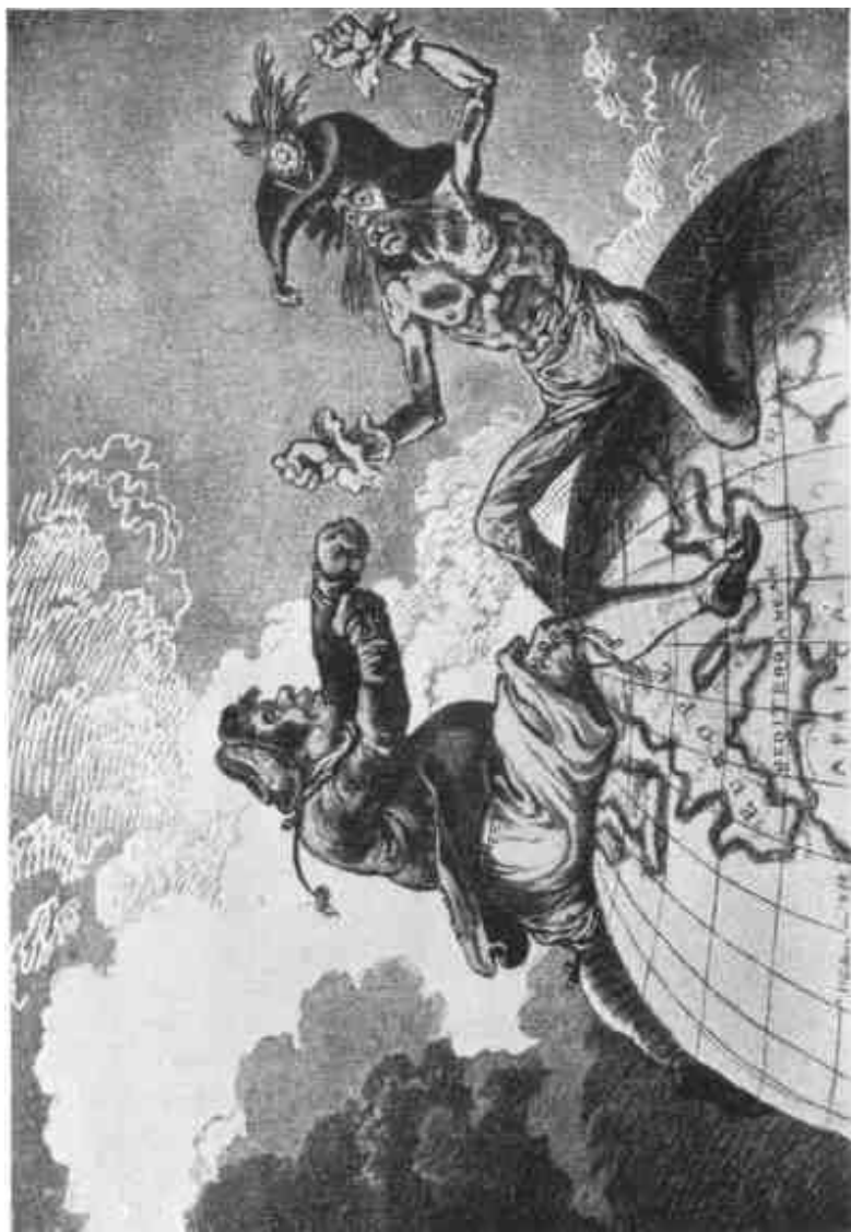
JAMES GILLRAY: Anglia és Franciaország (1798-1804).