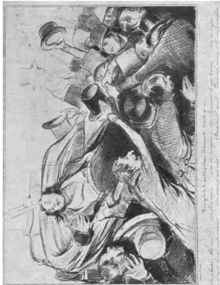
Hosszú, Dacum: A politikai becsületesség díszlata. A mépszerűség szatirja.