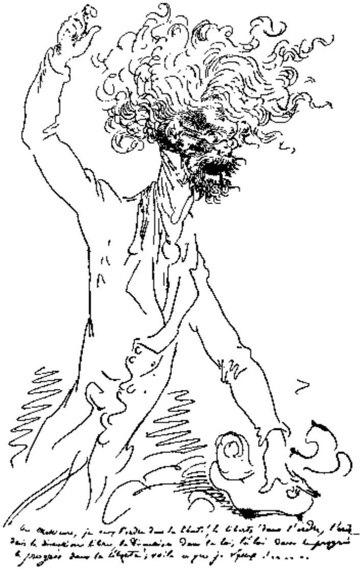
GUSTAVE DORE szatirikus rajza a hevesen filozofáló politikusról.