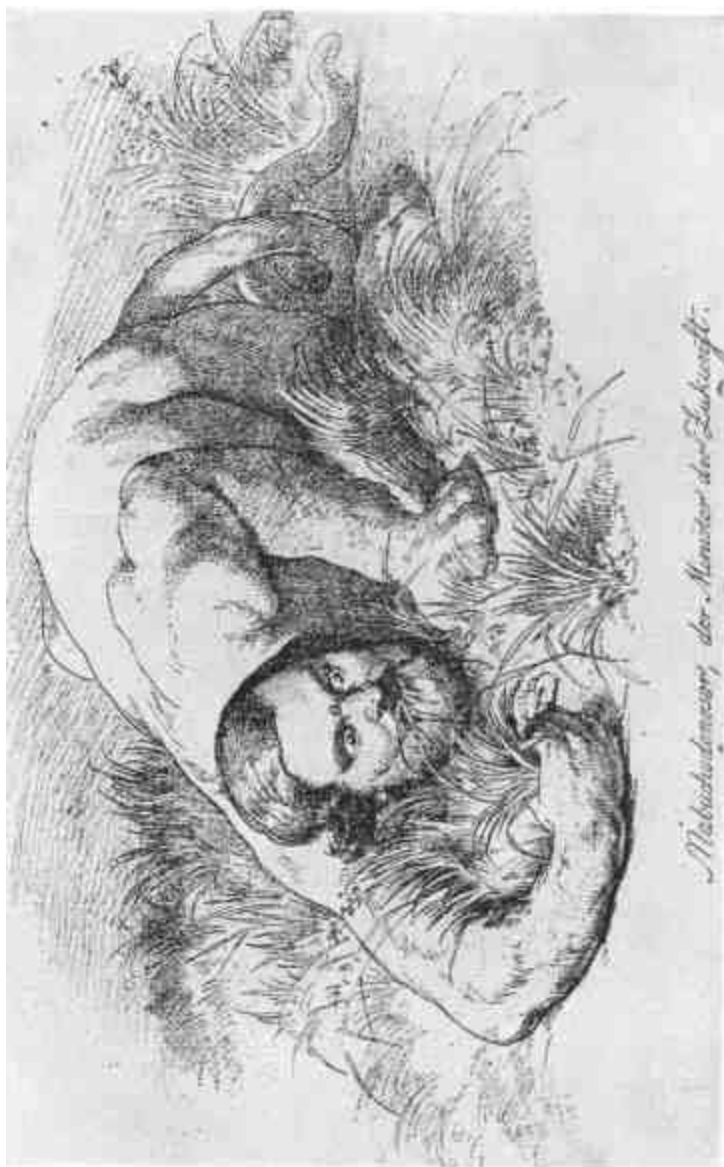
Nachschutzensen, der Minister der Zukünft.