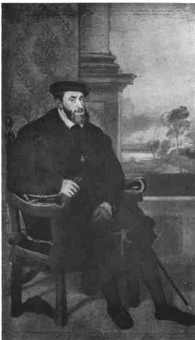
TIZIAN: V. Károly.