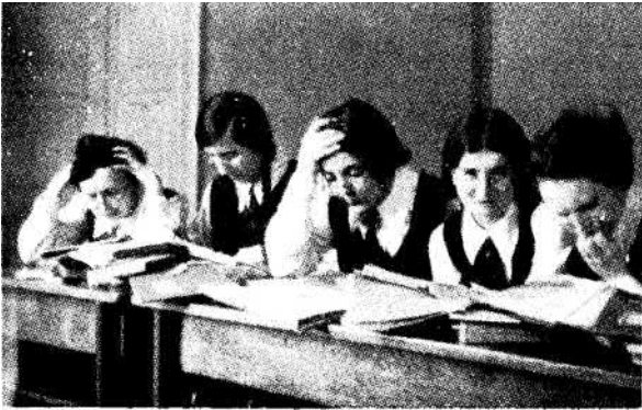
Néhány nyolcadikos a nehéz munkában.