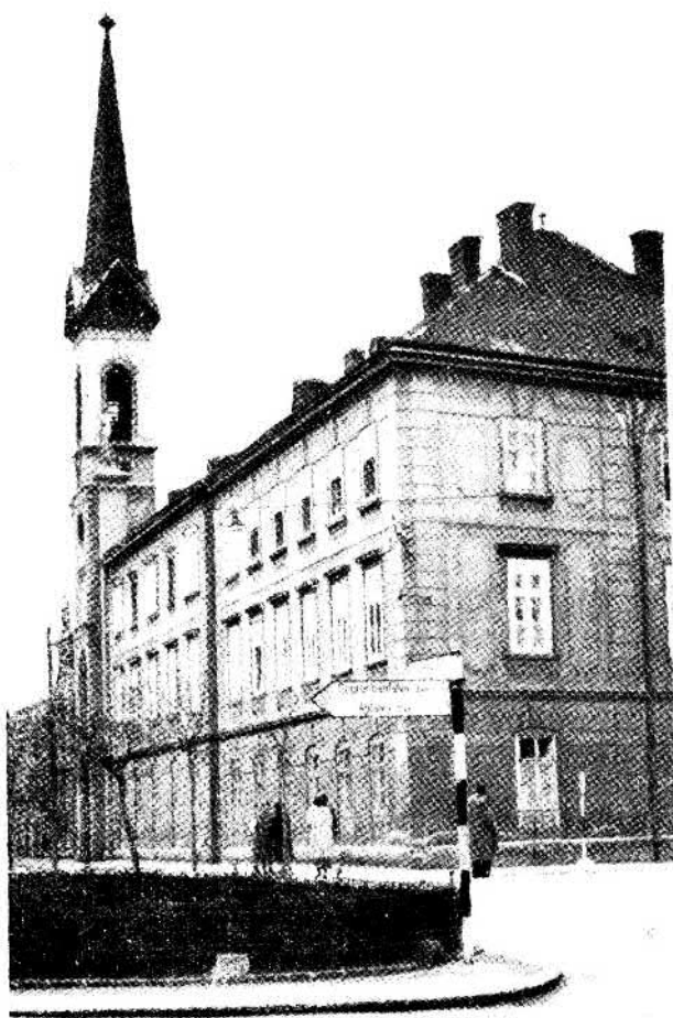
Az Isten Megváltó Leányai Anyaháza Sopronban.