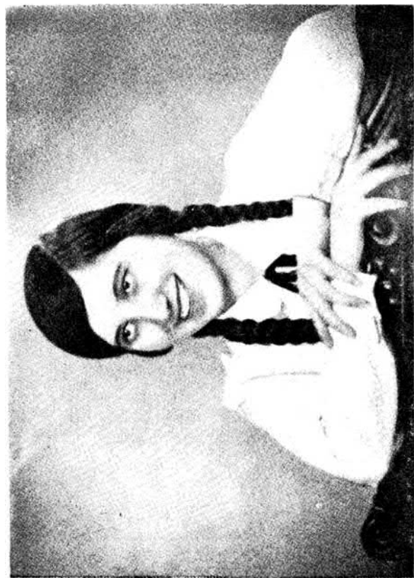
A gyermeklelkű nagyleány.