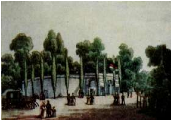
A NYÁRI SZÍNKÖR május