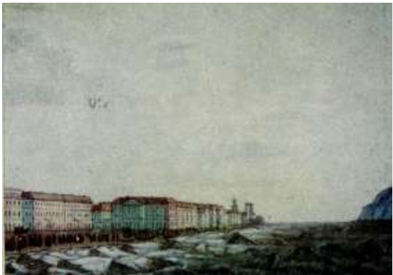
JÉGZAJLÁS A DUNÁN március