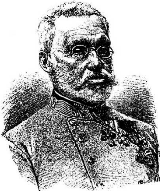
Albrecht főherceg, a custozzai hős.

Az éjszaki hadsereg oroszlánbátorsága dacára egyik vereséget a másik után szenvedte, míg az irtózatos könig-