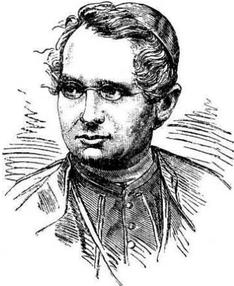
Dr. Haynald Lajos.

tüntessem a két egyaránt hazafias érzelmű főpap jóhiszemű eljárásában az ellentétet, — mely egyébiránt már 1848-ban is mutatkozott, de úgy, hogy akkor Fogarassyért hevültek, Haynald iránt meg elhültek a hevesebben dobogó honfiszívek: de a dolog különben is jellemzetes szignatúrája az akkori helyzetnek. Én magának Fogarassynak ajkairól hallottam az indokokat, melyek