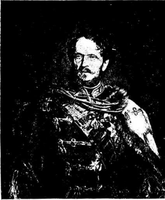
Gr. Andrássy Gyula.

nádori méltóságot majd végképpen meg kell szüntetni, holott ezen intézmény szinte együtt született magával az alkotmánynyal s egyaránt jó szolgálatokat tett királynak és országnak. Sikerült a királynak ezen aggályt is szétosztatnia.