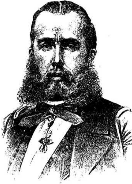
Miksa, mexikói császár

Miksát meggyilkolták 1867. június 19.-én. A mexikói szabadságharc történelmét egy soha le nem törülhető véres szenny folttal mocskolták be!