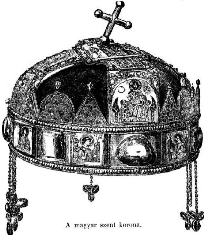
A magyar szent korona.

zokogtak, sírtak! Csak magyar ember értheti ezt, és ez is csak úgy, ha már tudja, milyen mély közjogi jelentőséggel párosul a koronázásnál az áhítat és szentség ihletének varázsa. A koronázás hazánk szabadságának és