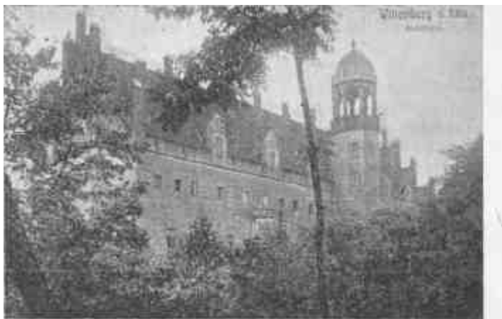
Luther lakóháza, az egykori Ágostonrendi kolostor.

Ahogy Luther a katedra felé haladt, „vaskos lábnyomától messze rengett” a padló. Aztán körül nézett villámló szemeivel s Insulamis fogékony magyar szívét ellenállhatatlanul meghódította egész lé-