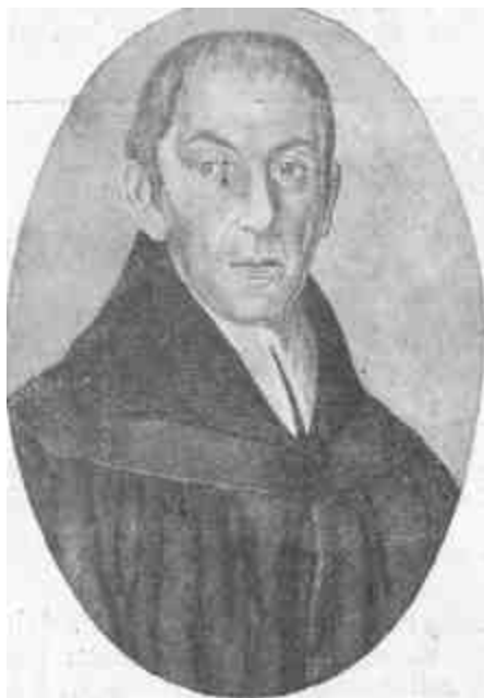
Kis János öregkori arcképe.

Mint emberre is rázúdultak a csapások. Jó feleségét elvesztette – öregségében kezdett a világ sötétülni körülötte, és pedig a szó közvetlen értelmében is, mert annyira rövidlátó lett, hogy a teljes megvakulástól kellett tartania. S mily bámulatos