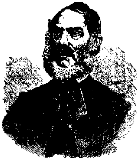
Bárá Radvánszky Antal.

mondta nekünk, hogy nagy vendégünk érkezik, az egyház egyetemes felügyelője, s azután megmagyarázta, mit jelent a hazának és az egyháznak a Eadvánszky név és mit jelent báró Radvánszky Antal egyénisége. És mikor a tisztes ősz férfiú megjelent közöttünk és buzdító szavakat intézett hozzánk, úgy érezte áhítattal figyelő lelkünk, mintha az egy-