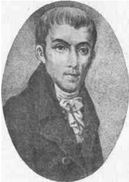
Kis János ifjúkori arcképe.

szönhette, hogy a jórészben nemes hívekből álló kővágóörsi gyülekezet bizalma ez előkelőbb állásra hívta el. Itt a kies Balaton vidékén, művelt evangélikus, református és katolikus papszomszédjai körében szintén kellemes három évet töltött el.