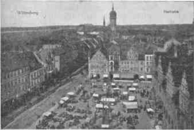
A wittenbergai főtér Luther és Melanchton szobrával. Háttérben a Vártemplom.