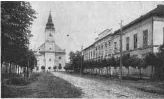
Az evangélikus templom és Tessedik egykori iskolája Szarvason.

Nézzünk körül az okszerúen művelt határban; sétáljunk egyet a városi parkban, az Alföld egyik legszebb közkertjében; álljunk szóba a Tessedik Sámuel-utcán végigmentünkben az értelmes, művelt szarvasi tót földműves-polgárokkal. Szívesen és tiszta magyarsággal felelnek kérdéseinkre. És meggyőződünk róla, hogy Tessedik Sámuel munkája