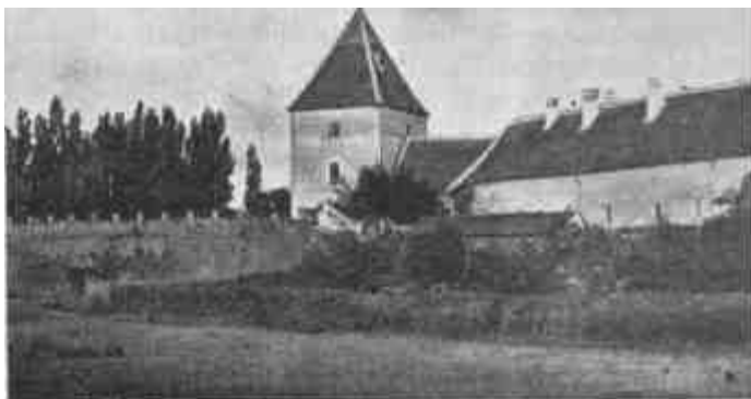
A sárvári egykori Nádasdy-várkastély.

Ezerötszáznegyvenegy augusztus 20-ikát írjuk: a kies Dunántúl kellős közepén, Sárvárrott, a magyar Wittenbergában vagyunk. Itt sokat megtalálunk abból, ami az igazi Wittenbergat huszonnégy év óta a világ érdeklődésének középpontjává teszi.