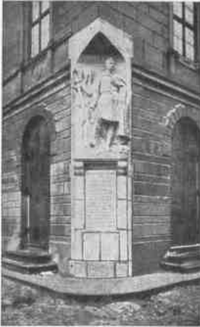
Az eperjesi vértanúk emléke.

1848-ban katonai szolgálatot vállalt és érdemei, határtalan vitézsége folytán a tábornoki rangig emelkedett. Sok csatában kitűnt a bálványozott ve-