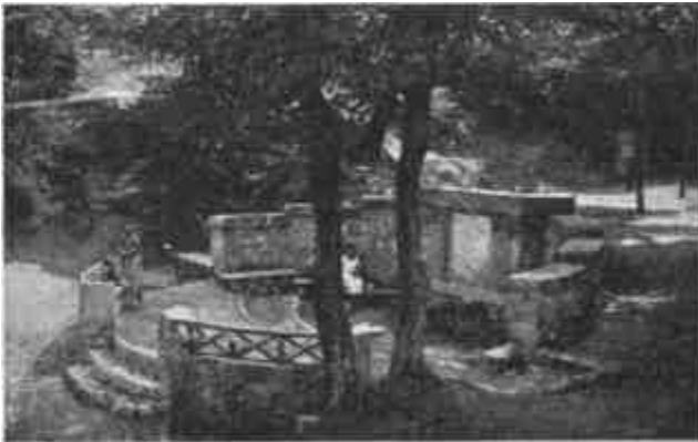
A soproni Deák-kút.

A diákság jórésze magvar ruhát visel, köztük nem egy nyugatmagyarországi német, vagy vend