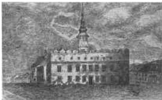
Az eperjesi kollégium régi alakjában.

Fent a díszteremben egy harmadik hősnek hatalmas olajfestményű arcképe tűnik szemünkbe: Des-