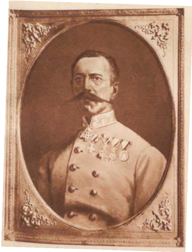
Báró Pultz Lajos altábornagy.