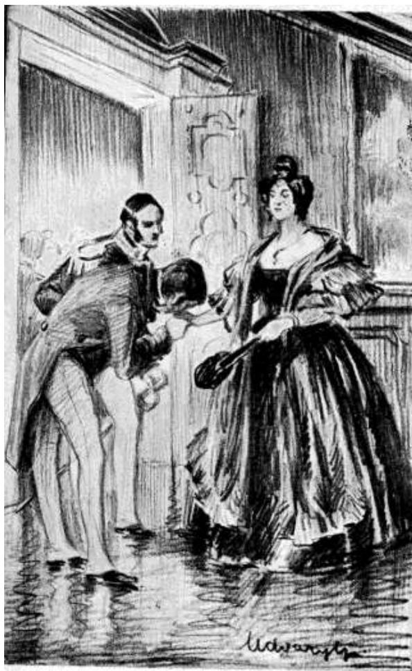
Turgenjev és mme Viardot.