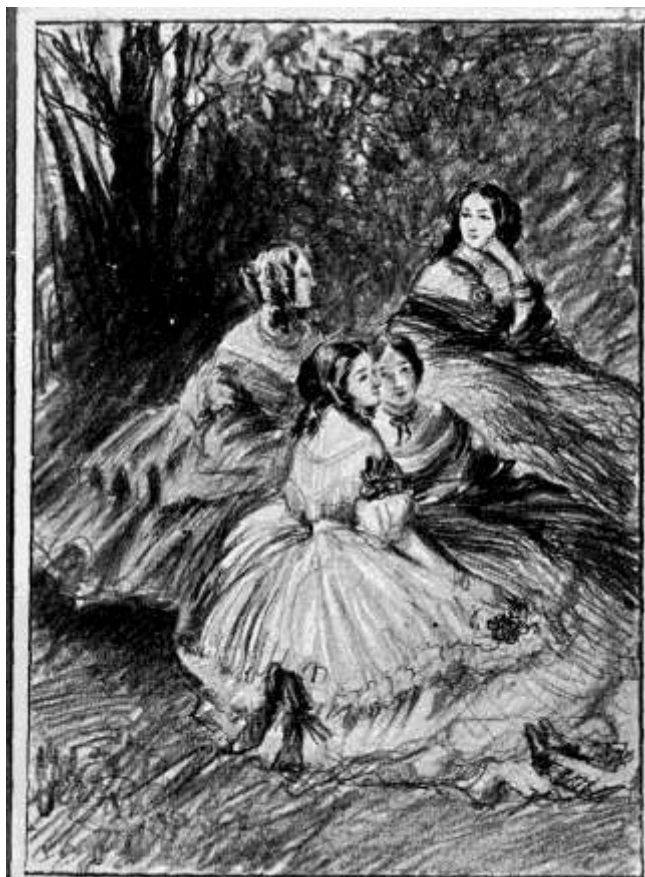
Udvari dámaok leveleiből.