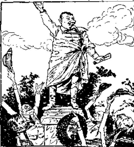
Vázsonyi karrikaturája a sajtószabadságért vívott harca idejéből

és annak az időszaki lapnak adok utcai terjesztésre engedelmet, amelynek akarok és attól tagadom meg ezt, amelytől meg akarom tagadni. Azt kellene kimondani, hogy a közigazgatási hatóság a megvonást csak akkor mondhatja ki, ha bizonyos időn belül bírói ítélettel megállapított, hogy az illető kolportázs-lap bizonyos deliktumokat rendszeresen elkövetett. ( Igaz! Úgy van! Helyeslés a bal. és a szélsőbaloldalon. ) Mert a közigazgatási hatóság tetszésétől tenni függővé azt, hogy mikor vonja meg a kolportázs-jogot, azt jelenti, hogy a sajtónak egy már kifejlődött és hatalmas része egyszerűen teljesen a közigazgatás önkényének van kiszolgáltatva.