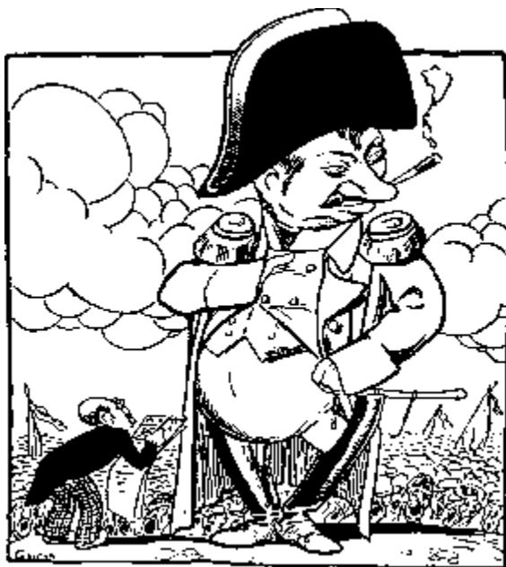
Gáspár karrikatúrája Vázsonyiról

A parlament a politikai élet legjelentékenyebb tényezője, de nem az egyetlen. Működésében szabadnak, függetlennek, utasítástól mentnek kell lennie, de azért nem lebeghet a levegőben, talapzattal kell bírnia és ez csak a társadalom lehet. Minden politikai erőnek és képességnek, mely megvan a társadalomban, felszínre kell jutnia, akár kedvezett neki a választások esélye, akár nem. Ha a társadalom lemond a politikai közreműködésről és néma szemlélésre szorítkozik, a parlament elveszti kötelességeinek tudatát, csak jogairól tud és túltengő önértékében magasabb rendűnek és zárkózott társadalomnak tekinti magát.