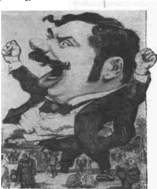
Bér Dezső karikatúrája 1901-ből

T. elvtársaim! Én politikai pályámon kegyelmet senkitől nem kértem. ( Éljenzés. ) Elnézést senkitől nem kívántam; köszönöm tehát, ha nekem ellenjelöltet állítanak és ha velem szemben a harcot felveszik. Azt azonban ország-világ előtt ki kell jelentenem, hogy abban a kerületben, ahol ott van a vasútigazgatóság, ahol, nagyszámban vannak az állami vállalkozók, annak a jelöltsége, aki a vasutasok főnöke, annak a jelöltsége, aki az állami vállalkozók legfőbb elbírálója, nem tiszta eszközökkel folytatott harc, mert így minden hagyományos szokással szakítva, amely azt parancsolja, hogy ne beszéljek az ellenjelöltreől, ki kell jelentenem, hogy ez a jelöltség már önmagában korrupció. ( Úgy van! Úgy van! Taps. )