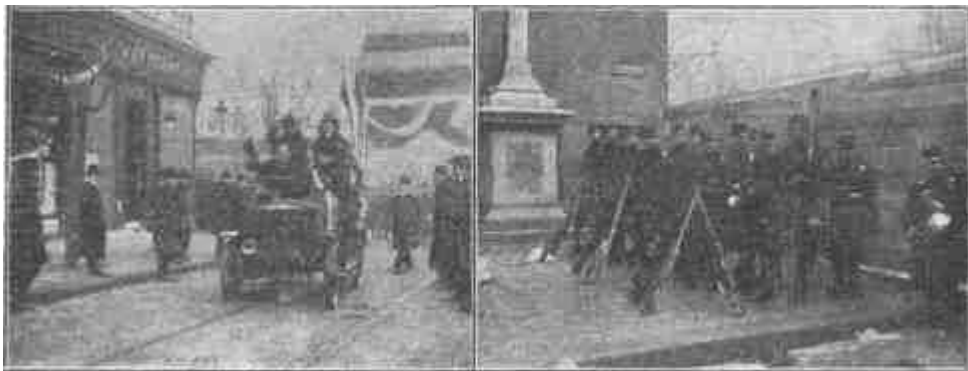
A terézvárosi utca a Vázsonyi-Hieronymi-választás napján