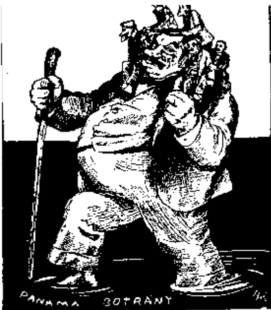
Karrikatura a Désy-Lukács-pör idejéből

A köz vagy mások megkárosítása csak egy súlyosított esete a panamának, de a panama már teljesen készen van az első konstruktív elemnél is, miként a hűtlen kezelésnél megvan az egyszerű eset, midőn valaki annak kárára dolgozik, kinek javára kellene dolgoznia, és a másik minősített eset, ha ezzel magának vagy másnak jogtalan hasznot akar szerezni, úgy a panamának minősített esete, hogy miféle kár vagy haszon