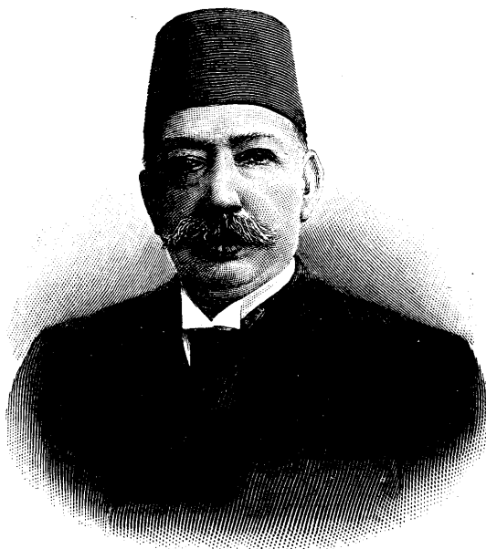
V. Mohamed török szultán.

Oroszországnak ez a törekvése hosszú időközön