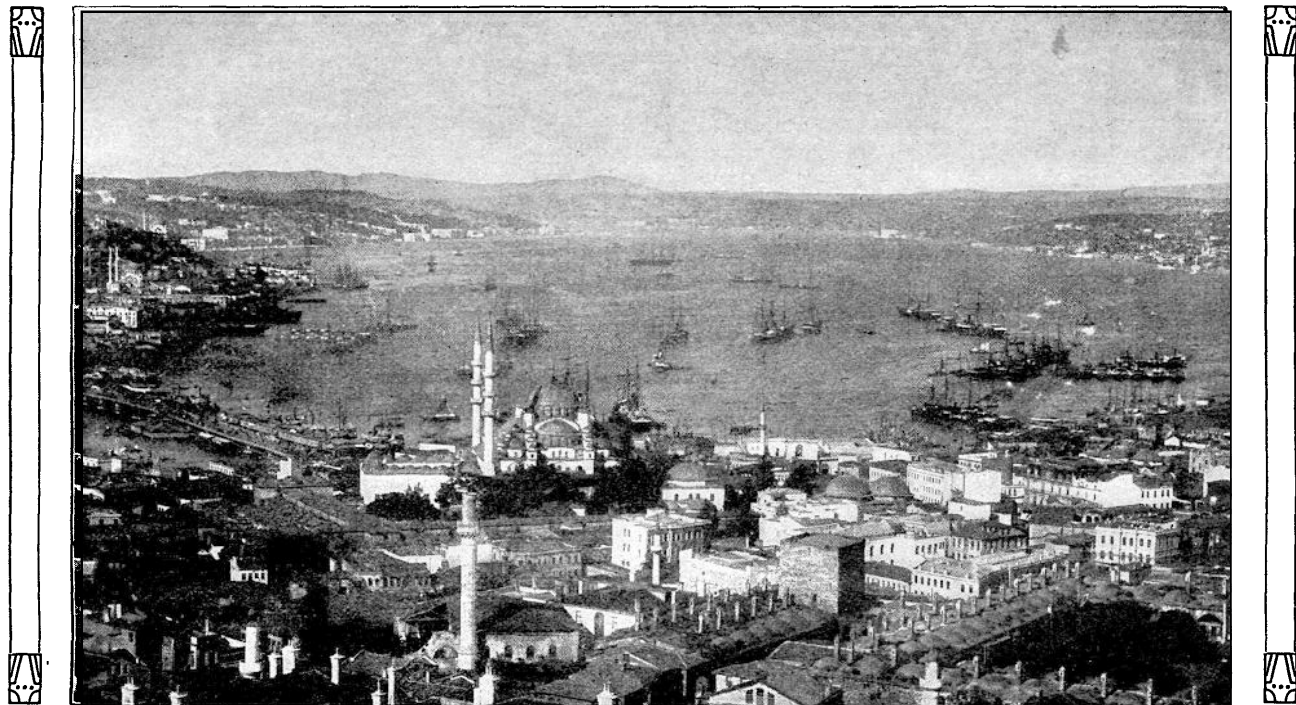
Konstantinápoly látképe. A kikötő és a Boszporus.

noksága alatt s nyolc sorhajóval, négy fregattal, több gyújtóhajóval és ágyúnaszáddal minden veszteség nélkül áthaladva a tengerszoroson, váratlanul megjelent Konstantinápoly előtt. Ez volt az első eset, hogy ellenséges flotta Bizánc ősi falait elérte.