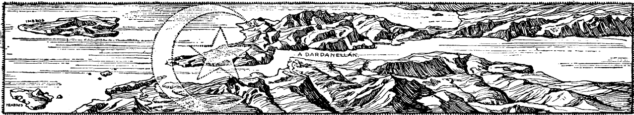
Helbing Ferenc eredeti rajza.