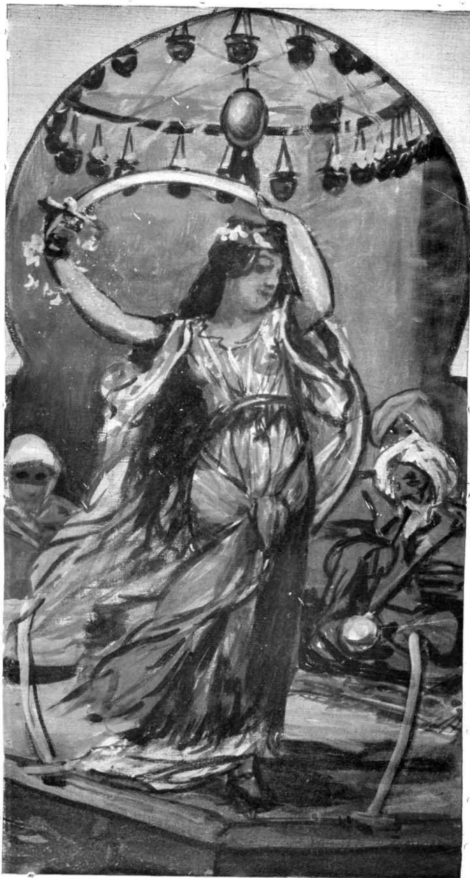
Vajda Zsigmond : SZMIRNIOTA