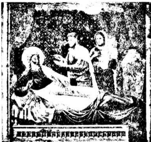
77. kép. CAVALLINI PIETRO (?): Izsák áldása. (Falkép, Assisi, felső templom.)

nek fia volt ez! — E festményben egy rendkívüli egyéniség merészsége és szenvedélyessége párosul a román formálatás nagyszerűségével, s diadalmas pathosának még a későbbi, a klasszikus, a pathetikus olasz festészetben is kevés méltó