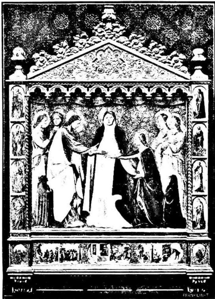
96 kép. GIOVANNI DAL PONTE: Szent Katalin eljegyzése (Tempera. Budapest, Szépművészeti Múzeum.)

veszi körül, az elmúlt évtizedek általános, sokszor stereotyp arcait jellegzetes egyéni fejek váltják föl, — a festészet külső eszközei is gyarapodtak: a perspektivikus érzés helyesebb és biztosabb, a színskála jelentékenyen gazdago-