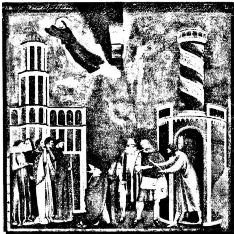
80. kép. A CECILIA-OLTÁR MESTERE: Szent Ferenc kiszabadítja assisi Pétert (XXVIII. freskó). (Falkép, Assisi, felső templom.)

vonalak, ez a józanság és valóhűség az életnek s az emberi léleknek meg- lepően változatos képét nyújtja. A román művészet szempontjából az új irányt naturalizmusnak lehetne nevezni; s csak ha mai álláspontunkból nézünk rá vissza, látjuk, mennyire távol van még e művészet a naturalizmustól, a természet köz- vetlen utánzásától. E festészet még emlékképekből táplálkozik, de csodálatosan