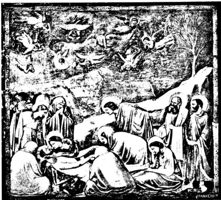
85. kép. Giotto: Krisztus siratása. (Falkép, Padova, Arena-kápolna.)