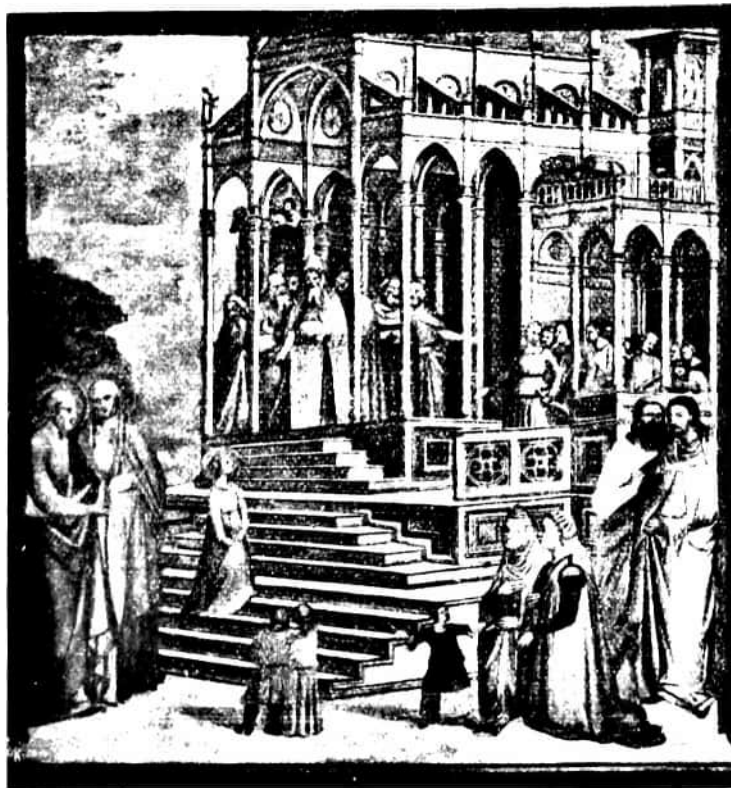
94. kép. GIOVANNI DA MILANO: Mária bemutatása a templomban. (Falkép, Firenze, S. Croce, Rinuccini-kápolna.)

E korszak dekoratív tendenciája termékeny talajra talált a fabrianói ALLEGRETTO NUZI-ban, kinek Fabriano, Macerata, a vatikáni Museo cristiano, Berlin őrzik ilyen irányú Madonna-képeit és FRANCESCUCIO GHISSI-ben, kinek unalomig ismétlődő Madonna dell' Umiltà-iban a diszítő törekvés már valósággal túlteng.