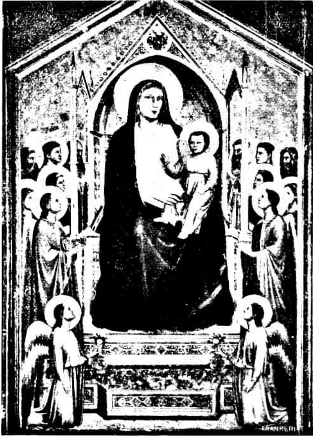
89. kép. GIOTTO: Madonna a trónuson. (Tempera, Firenze, Akadémia.)

hatalmasabbak, a drapéria nemesebb. Az alakok megnöttek. A kéz- és testmozdulatok rendkívül jellemzők; a lelkiek teljesen kifejezésre jutnak. A kompozíció egyszerű; nem tudni, vajon a tömegek külső elosztásának vagy belső összekapcsolásának van-e nagyobb része a hatásban? Evangelista Szent János mennybemenetele (88. kép) a legesudáltabb kép; néhány alakját Michelangelo is lerajzolta magának.