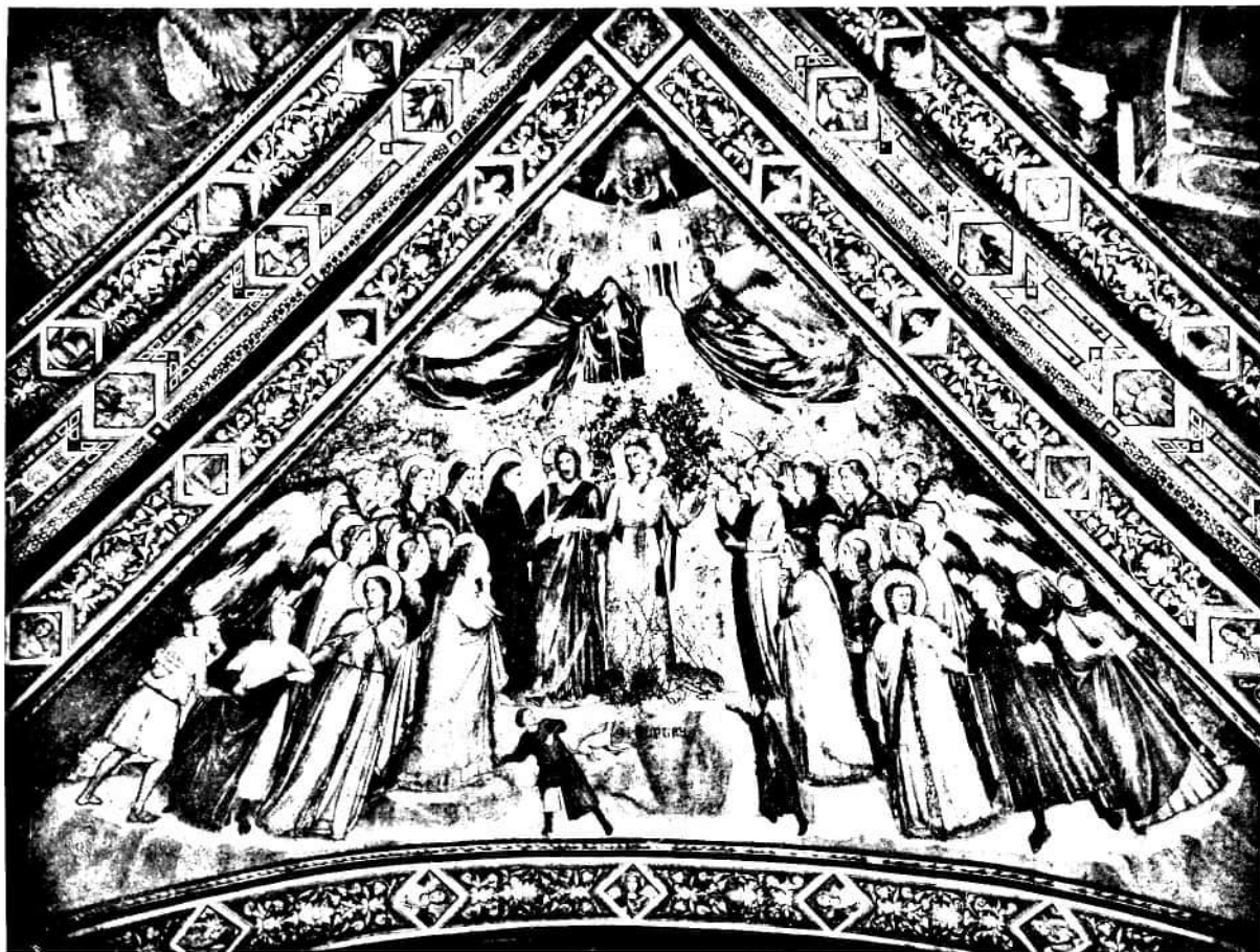
82 kép. Az ALLEGORIÁK MESTERE: A Szegénység (Falkép, Assisi, alsó templom).