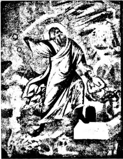
76. kép. CIMABUE tanítványa: Ábrahám áldozata. (Falkép, Assisi, felső templom.)

Az alsó templom hosszanti falain, melyeken később, a kápolnák hozzáépítésekor, nyílásokat törtek, vannak a legrégebb freskók romjai. 1236 körül készülhettek ezek. Szerzőjük bizonytalan. Szent Ferenc életét beszélik el, jeleneteit párhuzamba állítva Krisztus kinszenvedésének jeleneteivel. A fölismerhető jelenetek egyrészt: Ferenc leveti ruháit és a püspök köpenyébe takarozik, III. Ince álma a Laterán támaszáról, Ferenc a madaraknak prédikál, a stigmatizáció, a Szent halála, — másrészt: a kereszt felállítása, a keresztrefeszítés, a levétel a keresztről, a sírbatétel. Milyen glória vehette körül Szent Ferencet, ha halála után alig tíz