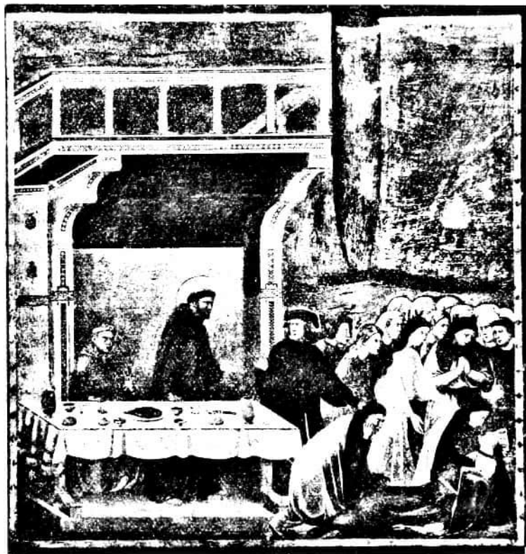
79. kép. GIOTTO (?): A celanói lovag halála. (XVI. freskó.) (Falkép, Assisi, felső templom.)

halálát és a Szent Ferenc stigmatizációját egyértelműleg neki tulajdonítják. De ha e híres freskósor több kéz műve is, s ha nem is állapítható meg kétségtelen határozottsággal, hogy melyek GIOTTO sajátkezű munkái, az bizonyos, hogy e sorozat a fölötte elvonuló freskósorral szemben egy hatalmas lépést jelent előre,