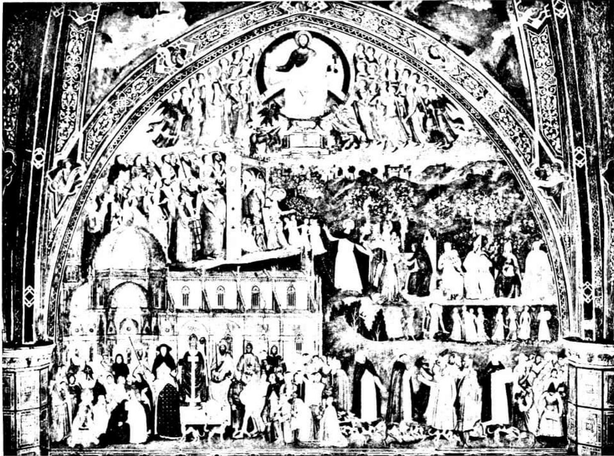
93. kép. ANDREA DA FIRENZE: A dominikánus rend hívása. (Falkép. Firenze, S. Maria Novella, spanyol lámpolat.)