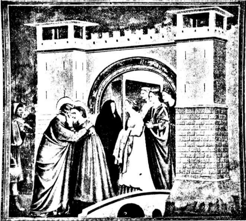
84. kép. Giotto: Anna és Joachim találkoznak az Arany kapunál (Falkép, Padova, Aréna-kápolna.)

A S. Maria dell' Arena freskóinak egymásutánja a következő: