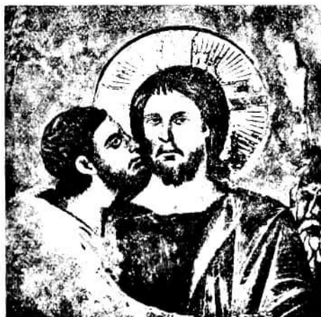
78. kép. TORRITI JACOPO (?): Judás csókja. Részlet. (Falkép, Assisi, felső templom.)