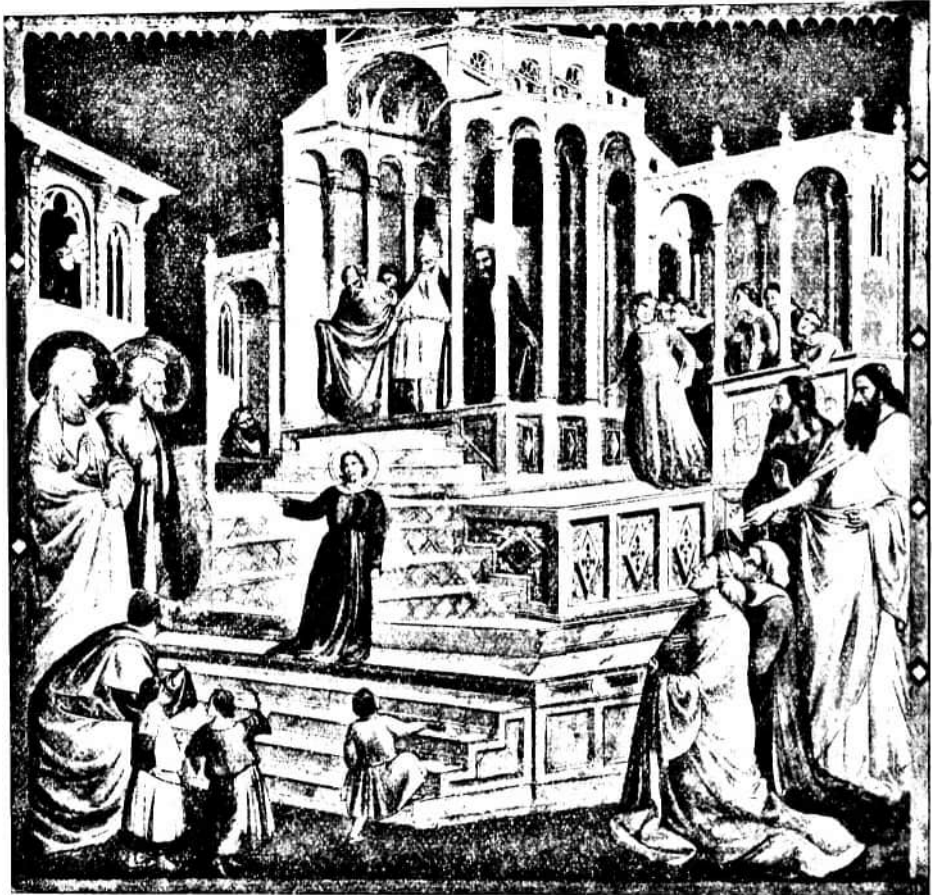
90. kép. TADDEO GADDI: Mária bemutatása a templomban. (Falkép, Firenze, Santa Croce, Baroncelli-kápolna.)

művei: Triptychon, ugyancsak a Baroncelli-kápolnában; triptychon Berlinben, 1334-ből, tizenkét kis kép Krisztus életének és tíz kis kép Szent Ferenc életének ábrázolásával Firenzében, az Akadémiában (ez utóbbi sorozatnak tizenegyedik darabja a berlini Kaiser Friedrich Museum-ban).