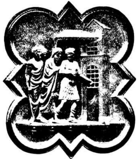
101. kép. ANDREA PISANO: Ker. Szent Jánost a börtönbe viszik. (Bronzrelief. Firenze, S. Giovanni.)