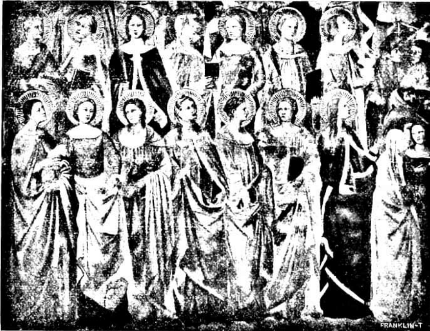
92. kép. NARDO DI CIONE: A menyország. Részlet. (Falkép, Firenze, S. Maria Novella, Strozzi-kápolna.)

Keresztrefeszítés ugyanott s végül neki tulajdonítható a XIV. század olasz festészetének egyik legérdekesebb és legfontosabb alkotása: a firenzei Santa Maria Novella templom «spanyol kápolna»-jának freskói. Az oltárfalon a keresztrefeszítés ábrázolása látható; a keleti falon a dominikánus rend hivatása (93. kép), a nyugatin aquinói Szent Tamás dicsőítése van szimbolikusan ábrázolva. A bejárat oldalán két jelenet Vértanú Szent Péter életéből. A boltozat négy süvegére a Navicella , Krisztus föltámadása , mennybemenetele , s a Szentlélek elbocsáttatása az aposto-