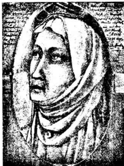
91. kép. Az ALLEGORIÁK MESTERE: Női fej. Töredék. (Freskó. Budapest, Szépművészeti Múzeum.)

ANDREA DA FIRENZE ezen iránynak egyik jelentősebb képviselője. Művei: a pisai, Camposantóban három falkép Szt. Rájner életéből vett jelenetekkel; a