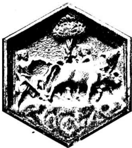
103. kép. ANDREA PISANO: A földművelés. (Márványrelief. Firenze, Campanile.)

A trecento e dekoratív tendenciájú második nemzedékének legkitűnőbb képviselője ANDREA DI CIONE, művész nevén ORCAGNA (1329—1368). 1359-ben fejezte be a firenzei Orsanmichele tabernaculumát. Páratlan pompájú kis márványépület ez; tele domborművekkel, szobrokkal, csipkeszerűen finom faragásokkal, színes mozaikdíszsel. Emellett a gazdagsághoz semmi túlzás s a legkényesebben megóvott rend a dekoráció látszólagos forgatagában. A szobrászati részekben sok érzés, sok lágység — egyes reliefek egészen festőiek. Orcagnának egyéb plasztikai munkáját nem ismerjük, de művészeti jelleme e tabernaculumnak rendkívüli gazdagságában minden oldalról meghatározódik (104. kép).