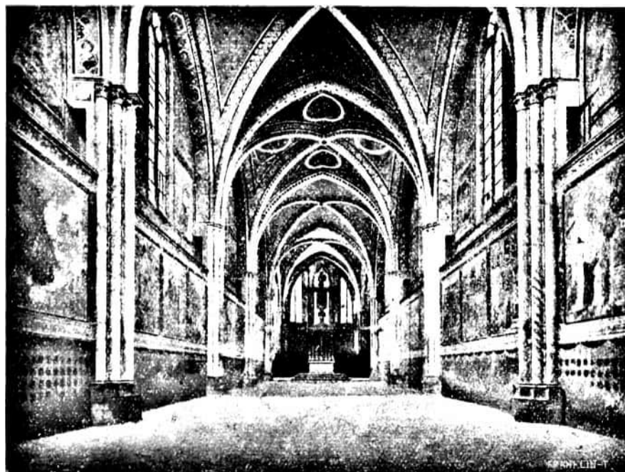
74. kép. Az assisi felső templom.