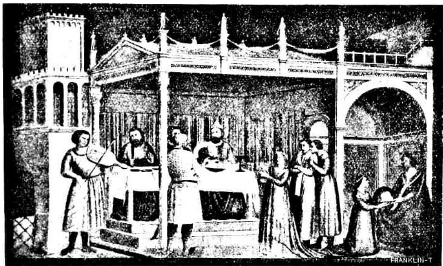
87. kép. Giotto: Heródes lakomája. (Falkép, Firenze, Santa Croce, Peruzzi-kápolna.)