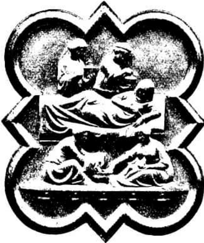
100. kép. ANDREA PISANO: Ker. Szent János születése. (Bronzrelief. Firenze, S. Giovanni.)

teremtését és fejlődését s az emberi foglalkozásokat ábrázolják ezek a reliefek. Hatszögű mezőkbe nagy művészettel szerkesztett, kevésvel sokatmondó kompozí- ciókat