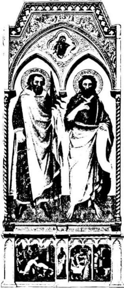
95. kép. SPINELLO ARETINO: Szent Nemesius és Ker. Szent János. (Tempera. Budapest Szépművészeti Múzeum.)

Taddeo Gaddi hatása alatt, ilyen továbbá SPINELLO ARETINO, kinek a firenzei San Miniatóban, Arezzóban, a pisai Camposantóban és a sienai Palazzo Pubblico-ban levő freskósorai élénk temperamentumról s nagy termékenységről tanúskodnak. Neki és tanítványának GIOVANNI DAL PONTE-nek, egy-egy szép oltárképét őrzi a budapesti Szépművészeti Múzeum (95. és 96. kép).