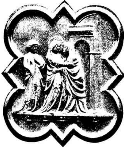
99. kép. ANDREA PISANO: Mária találkozása Erzsébettel. (Bronzrelief. Firenze, S. Giovanni.)

ANDREA DI UGOLINO PISANO (1273—1348) Giotto művészeti elveit való- sítja meg a plasztikában. Leghíresebb műve a firenzei baptistérium déli érckapuja,