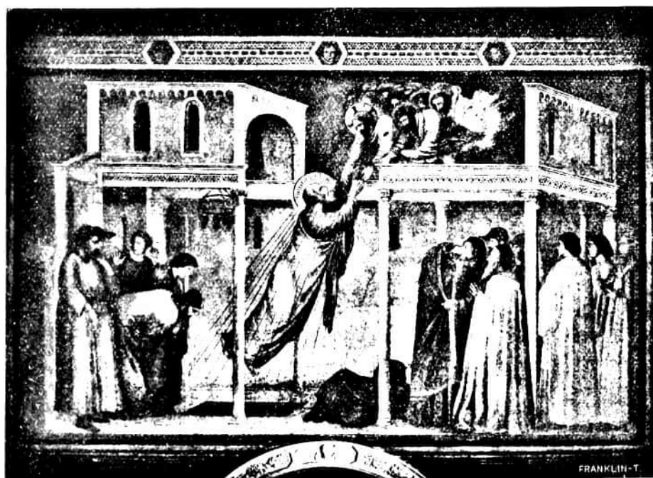
88. kép. Giotto: Evangélista Szt. János mennybemenetele. (Falkép, Firenze, Santa Croce, Peruzzi kápolna.)