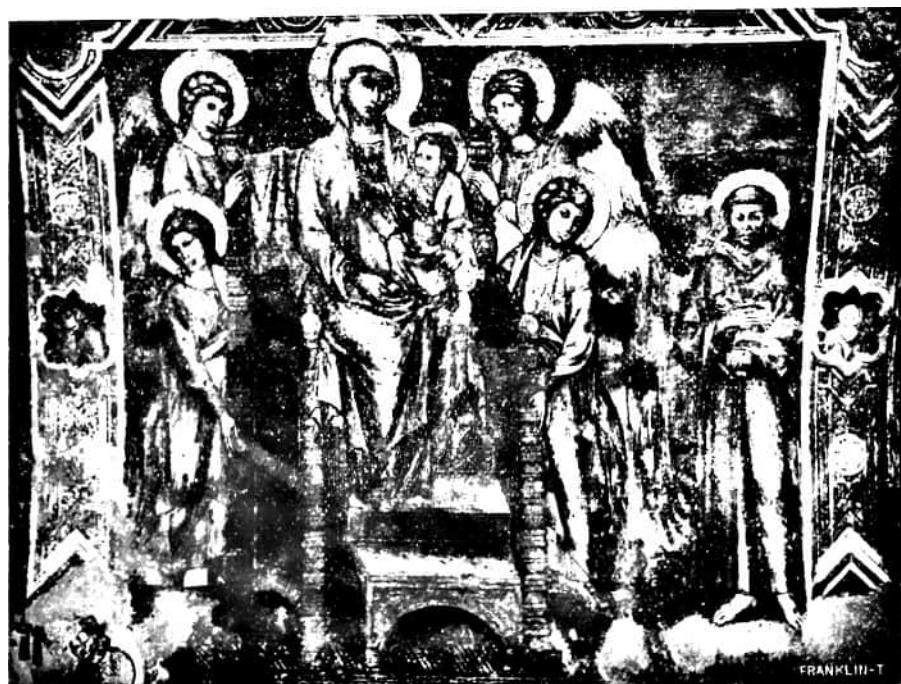
75. kép. CIMABUE: Madonna trónon és Szt. Ferenc. (Falkép, Assisi, alsó templom.)