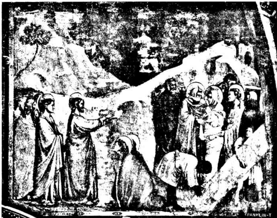
81. kép. Giotto: Lázár feltámasztása. (Falkép, Assisi, alsó templom, Magdolna-kápolna.)

GIOTTO követői között két határozottan fölismerhető egyéniség van, kiknek nevét mindeddig nem tudjuk: az egyik a már említett S. Cecilia-oltár mestere,