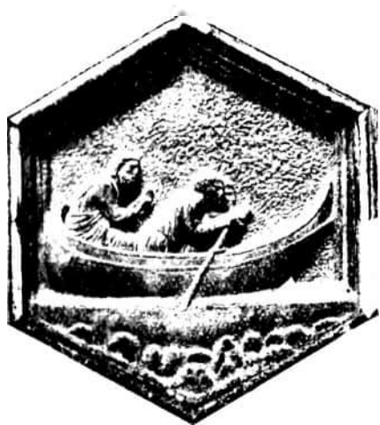
102. kép. ANDREA PISANO: A hajózás. (Márványrelief. Firenze, Campanile.)