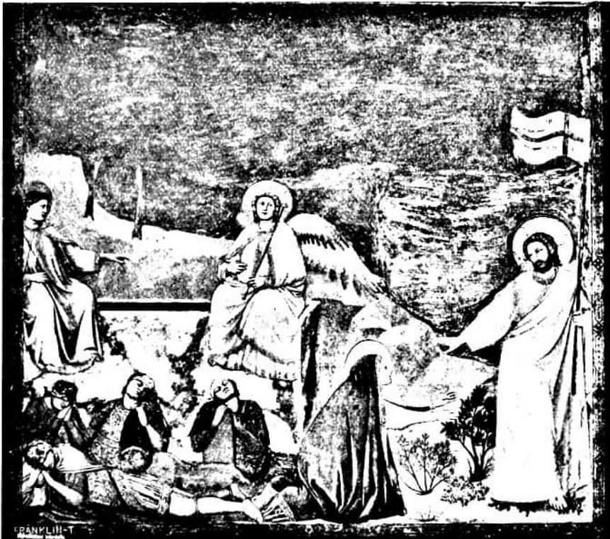
86. kép. Giotto: Noli me tangere. (Falkép, Padova, Arena-kápolna.)