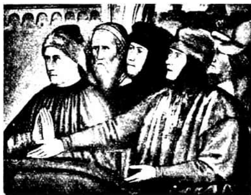
98. kép. ALTICHIERO és AVANZO: Szent Lucia csodatétele. Részlet (Falkép, Padova, Oratorio di S. Giorgio.)

hatása érzik s e két művész már beletartozik azok csoportjába, kiket a történet rendszerint a renaissance fejezetben szokott tárgyalni, de akik még mindig a gotikus művészet késői, gyönyörű hajtásai: Pisanello, Gentile de Fabriano, Masolino, Lorenzo da Sanseverino csoportjába.