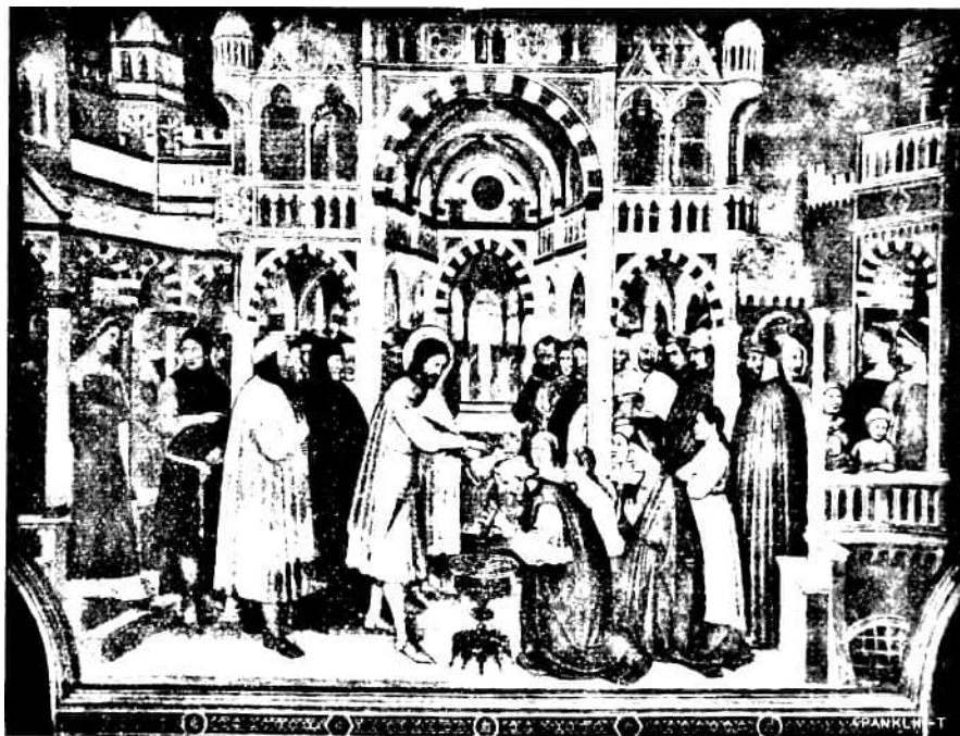
97. kép. ALTICHIERO és AVANZO: Szent György megkereszteli a királyt. (Falkép, Padova, Oratorio di S. Giorgio.)

hatása érzik s e két művész már beletartozik azok csoportjába, kiket a történet rendszerint a renaissance fejezetben szokott tárgyalni, de akik még mindig a gotikus művészet késői, gyönyörű hajtásai: Pisanello, Gentile de Fabriano, Masolino, Lorenzo da Sanseverino csoportjába.