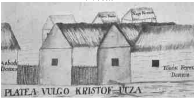
Parasztházak Pápán a XVIII. században. Az eredeti rajz a pápai pálosrendi kolostor birtokairól Szabadhegyi Mihály által 1773-ban készített s az Országos Levéltárban «Htt. térképek div. 9. no. 104.» jelzet alatt őrzött térképfűzetben.