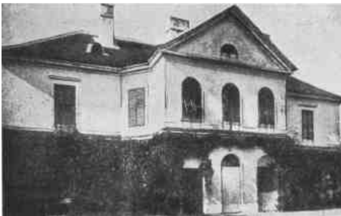
«Bene possessionatus» nemesi család kúriája. Az Ostffy-kastély Ostffyasszonyfán Vas megyében.