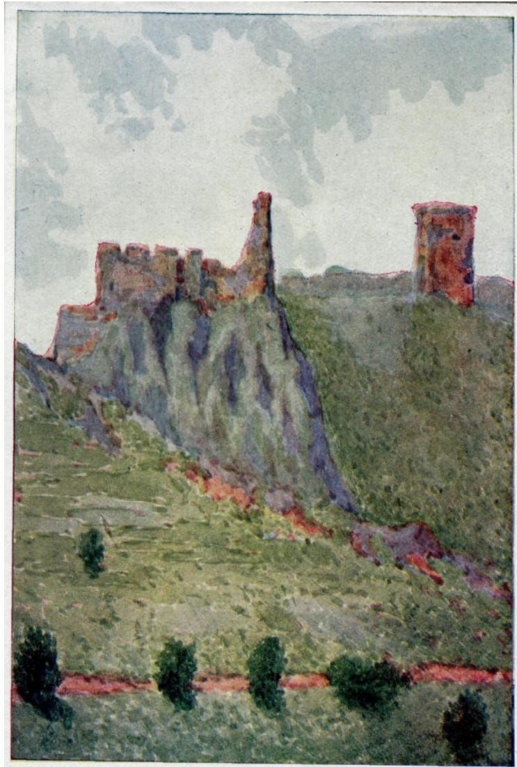
TÓTH ISTVÁN: A TOROCKÓSZENTGYÖRGYI VÁRROMOK